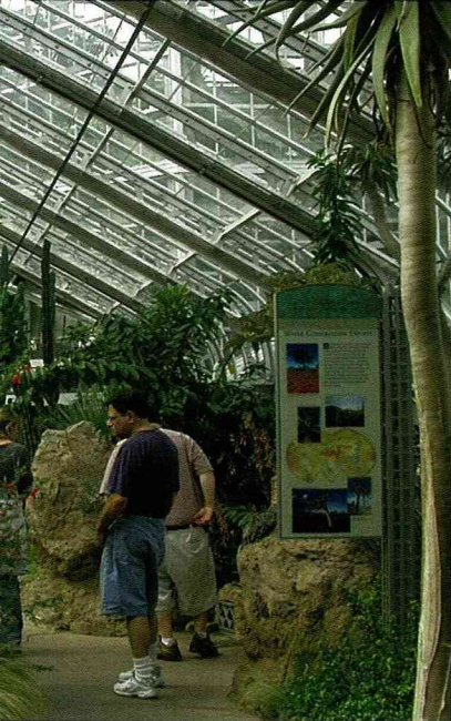
多肉植物溫室內，溫濕度調節精密、解說牌清楚簡單

有解說教育中心，另有學術討論用之會場，動線分明，雖然是平日前往，亦不乏全家攙扶長者、輪椅、嬰兒車等聚集在