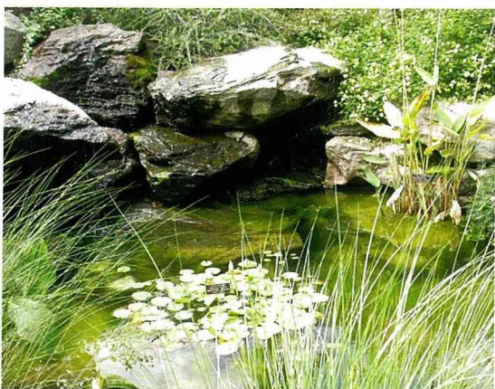
位於藥用植物溫室內之水生植物區造景一隅

植物園的歷史可追溯至1816年，當時的美國國會即倡議興建一所兼具植物品種收集、栽培、散佈、教育等功用之植物園。於是便選定位於國會山莊西側，興建植物園。主建築於1820年完成，作為保存、展示用；1994年，完成佔地面積8萬5千平方尺，擁有34個16種氣候區的玻璃溫室。