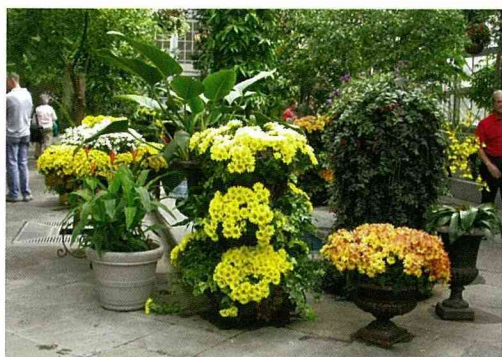
進入主建築後之中庭，多以雛菊在可移動式之容器作裝飾，機動性大且易管理

植物園的建築風格延續國會山莊之圓頂狀屋頂主建築物。主館為一層樓的空間，溫室建築物另行挑高數十米不等，主出入口的庭園