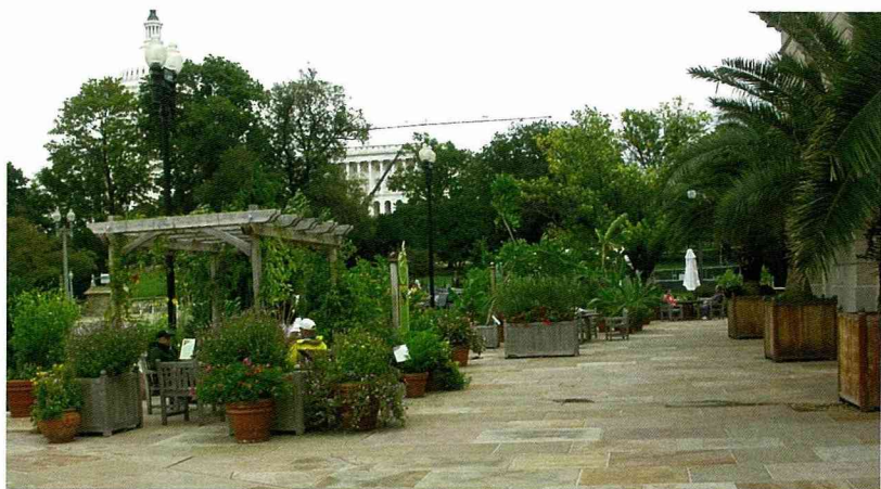
戶外亦以可移動式之容器植物作裝飾