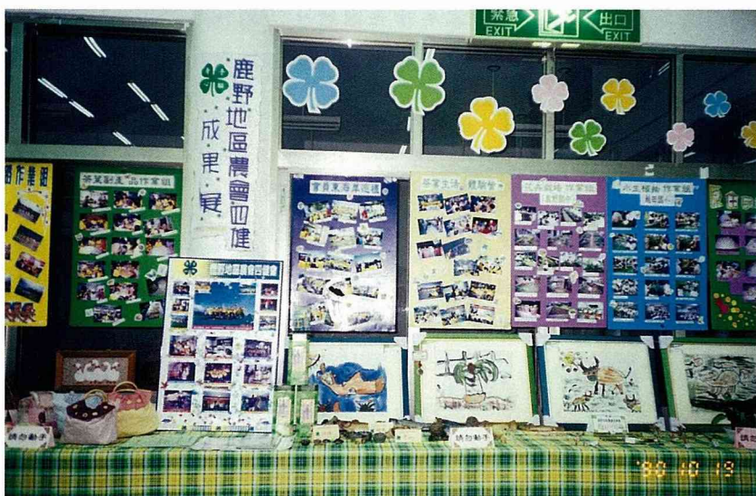
鹿野地區農會四健成果展