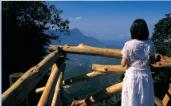
在留龍頭觀景台憑欄可遠眺濁水溪