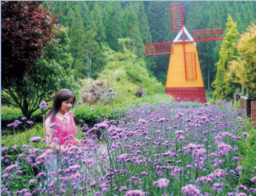
歐洲風情的藥花園

杉 林溪森林遊樂區的氣候屬於溫帶季風氣候區，常年雨量充沛，青山綠水，四季花開，是提供休閒旅遊、登山踏青、蜜月渡假，享受大自然陶冶身心的最佳去處。