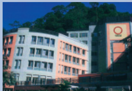
杉林溪大飯店壯麗的外觀。