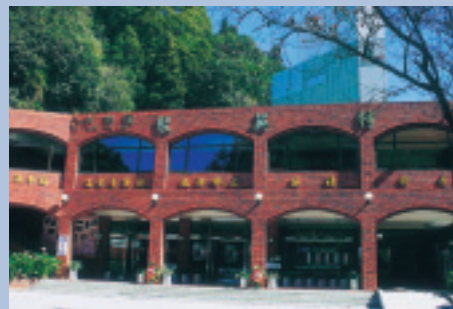
林木掩映下的聚英村。