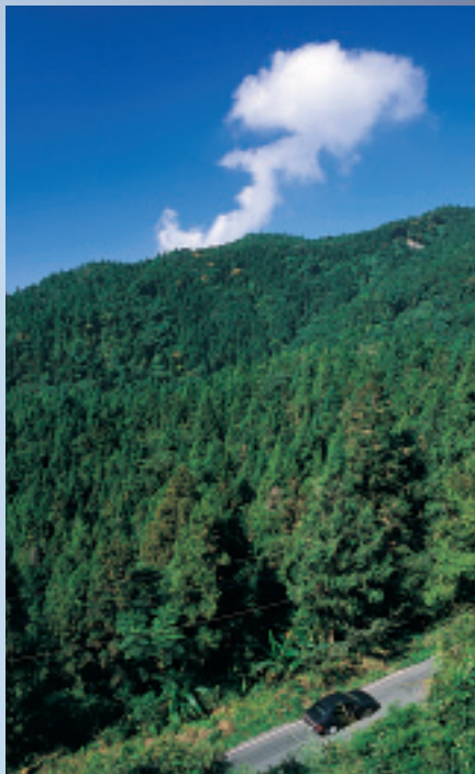
溪阿公路每轉一個彎就延伸視野