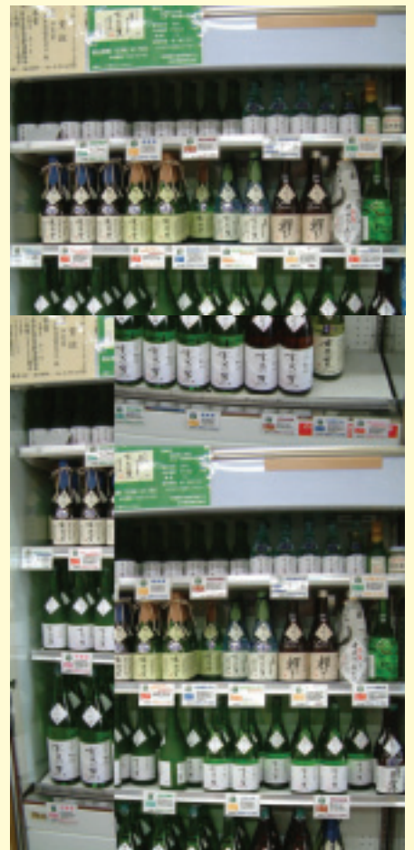
各等級的水芭蕉酒