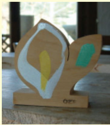
木製水芭蕉紀念品

上積雪開始融化，冰冷的雪水順坡而下，此時整座山盛開的奇特景象，這就是令人懸念的水芭蕉饗宴。