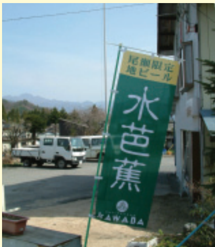
定點販賣水芭蕉酒

水芭蕉不愧為尊貴的村寶，培植條件很麻煩，不但要水量充足，水流還必須低溫、湍急、乾淨，就像鱒魚必須生存在含氧量特高、低溫清澈的水中一樣。雖然店員們苦口婆心地解說，而說明書中也寫得很明白，其