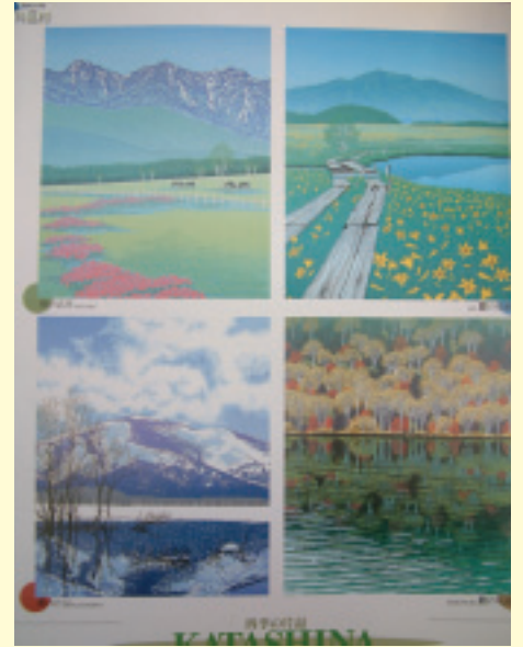
片品村農協以村里四季為題所做的月曆，其中也有水芭蕉的身影

片品村位於寒冷高山地區，每年11月至翌年2-3月的寒冬季節，山區深達1-2公尺的積雪，吸引各地愛好滑雪的遊客前來，形成觀光熱潮，到了3月春暖花開之際，山