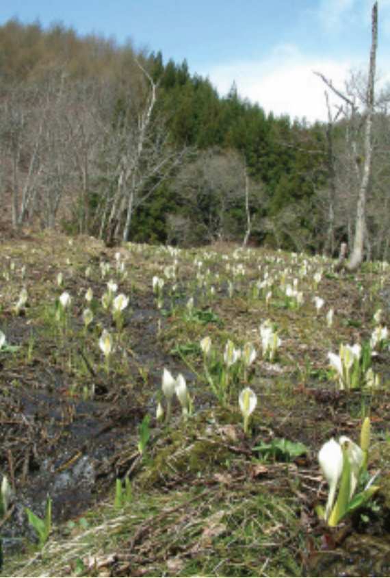
春季乍至，不畏寒的水芭蕉已冒出頭來了