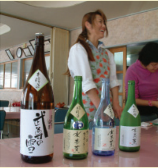
民宿主人連夜提貨的水芭蕉酒

年求學、生活、工作的我來說，日本就如太陽底下，了無新鮮事。這些刻板印象，卻在2000年4月被打破了！