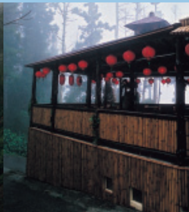
座落在石桌地區的龍雲休閒農場