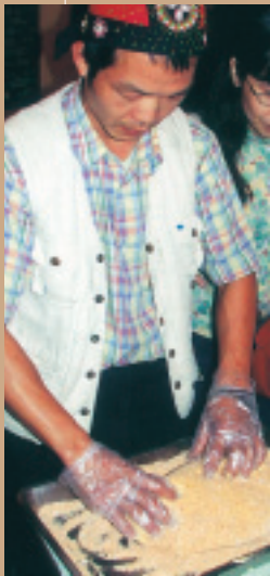
麻糬蘸上花生粉與糖粉，即可食用。