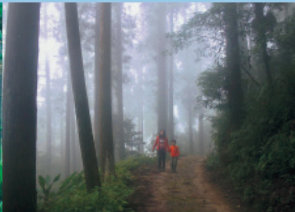
農場的林間步道午後經常籠罩雲霧