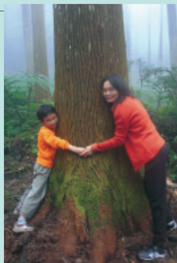
參天巨木隱身於縹緲雲霧間

擁有放眼綠盈樹海，3000多種藥用植物，以及大片竹林、櫻花林等自然資源的龍雲休閒農場，是國內第一座民間自行成立的「自然生態保育區」，區內保留了廣闊的林地，有林相優美的杉木林、茂盛的竹林，以及溫帶、寒帶的原生林木，如紅豆杉、冷杉、雲杉、鐵杉等；而悠遊在森林底層的動物，則有藍腹鵝、飛鼠、山羌、白鼻心、穿山甲等鳥禽走獸。當遊客在林間漫步悠遊時，經常可與野生動物