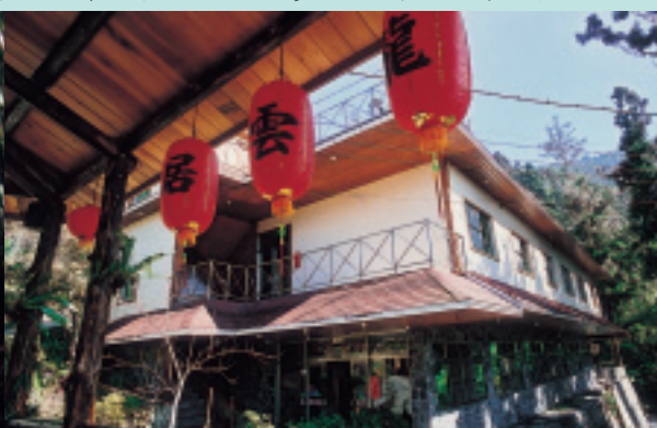
龍雲休閒農場備有木造雅房

物們驚遇。入夜後，能夠觀賞到野生的螢火蟲，提著小燈籠在林間滿天飛舞，運氣好的話，還可以碰見貓頭鷹，在枝頭上與您咕嚕打招呼。