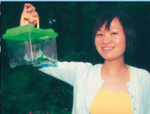
蛙類生態觀察與體驗