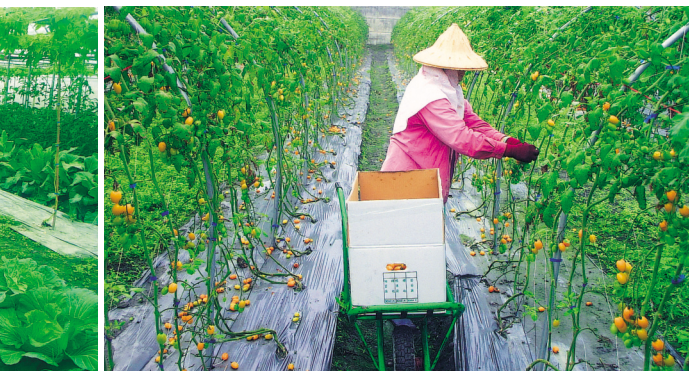
覆蓋塑膠布防止雜草孳生