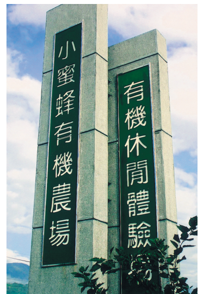
公路旁的小蜜蜂有機農場巨型招牌

栽培這些蔬果的耕作方法，完全遵照有機農產品生產基準進行，基肥與追肥完全用有機質肥料，以覆蓋塑膠布和稻殼，來防止雜草孳生，部份雜草都用人工拔除。生長栽培期間，菜園周邊用黃色粘板，以減少害蟲為害，並用蘇力菌防治蚜蟲、小菜蛾等害蟲，用肉桂油防治露菌病、炭疽病等，完全不施用化學藥劑，效果非常良好。灌溉農作物的用水，是來自乾淨無汙染的山泉溪水，以水旱田輪作方