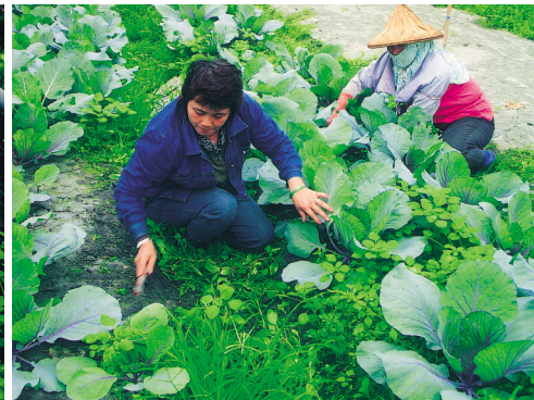
部份雜草用人工拔除