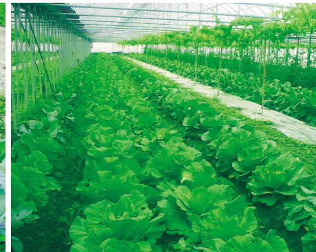
設施栽培有機蔬菜