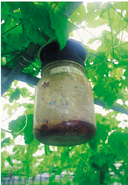
溫室內生物防治害蟲