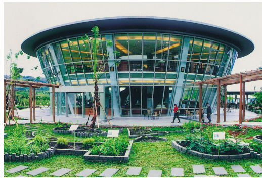
飛碟造型的植物生活伴手禮