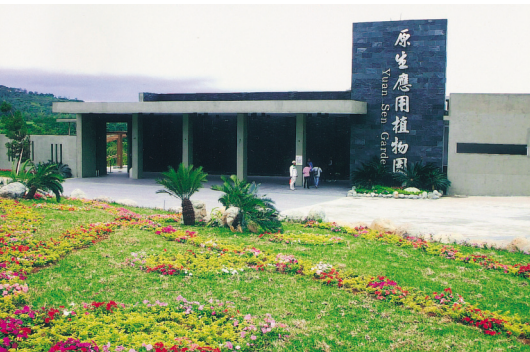
台東原生應用植物園迎賓大門