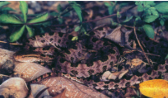
龜殼花生性兇暴，攻擊性強

卵生，在台灣很普遍，而且分佈很廣。特徵為在身體上部為淺色帶有棕黑色的各種斑點；喜歡棲息於矮灌木林和草地，性情兇