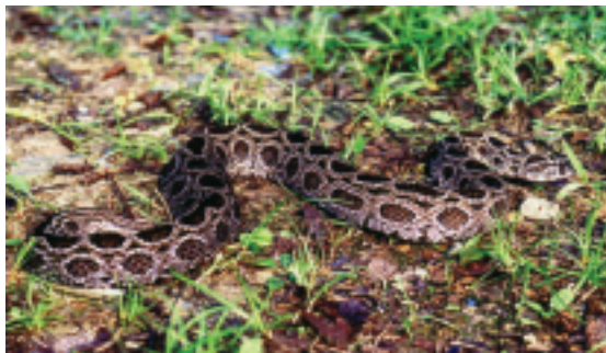
鎖蛇主要分佈於東部近中央山脈一帶

又稱為鎖鍊蛇，卵胎生，分佈於東部近中央山脈一帶。特徵為頭呈三角形，體呈灰棕色，但具有形狀不一的棕色斑點。喜歡棲息於中、低山區的林木中，性兇猛，致死率排行第六。