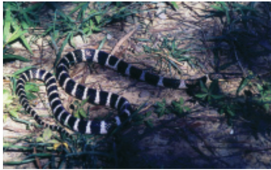
雨傘節身上具有黑白橫條，且喜歡棲息於較潮溼陰涼處

帶有白色環紋，較容易被一般人所認識，頭是橢圓形。喜歡棲息於較潮溼的水源處所，為夜行性的蛇。放毒量為3-4公絲，在這6種毒蛇中其毒液的毒性最強，致死率排行第二。