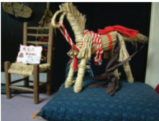
村中的吉祥物—寶馬。

於是這7位媽媽們，由真理呼帶領，開始朝著她們的夢想逐步前進。至於她們的夢想是什麼呢？她們希望：未來每個從村裡出身的孩子都能對這個村有極深的認同及感情，外出謀生的學子能夠很驕傲地告訴別人自己在片品村快樂的成長過程及故鄉的生活點滴，能與外人分享片品村獨特的文化、人文與美好的回憶，並以自信、歡愉的口吻，