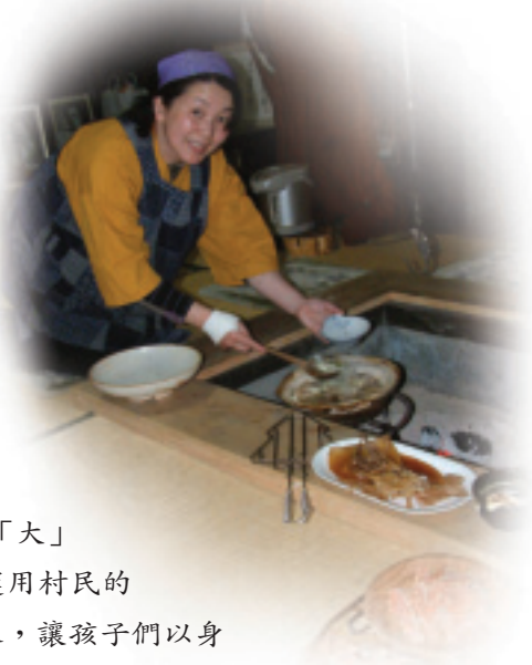
寒帶地區特有的地爐

P.S. 本會將不定期舉辦至片品村參訪研習活動，意者請洽：0926-216-848或02-2792-9377