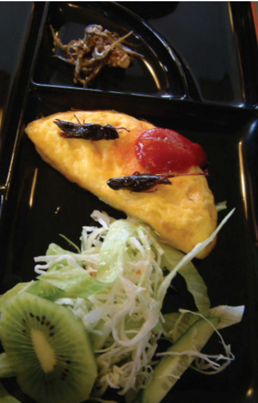
兩隻蟋蟀「生動」地呈現在我們的早餐上

群馬縣是全日本最窮的縣，而片品村也可說是縣內經濟最差的一個村莊。其偏僻程度從距離新幹線車站約1個多小時車程，國