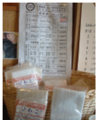
為了保護河流，環保媽媽帶領研發免洗滌劑的毛巾