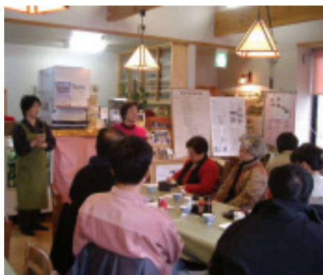
每個人都看到一個村的希望與未來

就是「文化衝擊」。漢朝的王昭君將中原文化傳至西域，唐朝時，中原文化多受西域文化影響，文化也因此更加豐富多元起來。就近代來說，受到全球化的影響，東西方文化交流頻繁，服裝、家具、擺設等方面皆有同化之趨