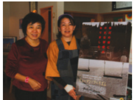
真理呼所設計的「回到生命原點」海報