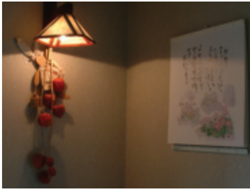
野花雜草是最自然的裝飾