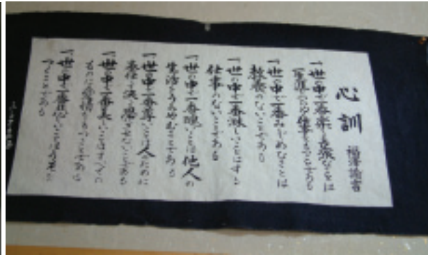
民宿可是文化教育最好的地方