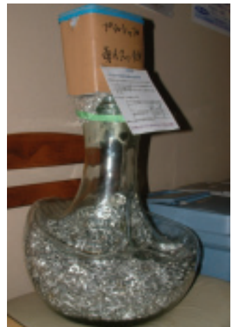
幫助殘障人士的「愛心環」