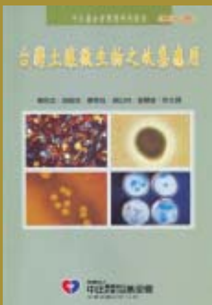
92-12台灣土壤微生物之收集應用(200元)