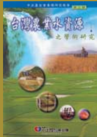
91-10-30台灣農業水資源之學術研究