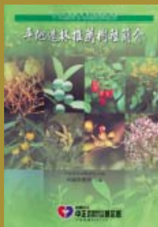
93-11平地造林推薦樹種簡介(150元)