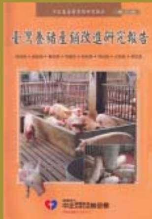
92-10-11台灣養豬產銷改進研究報告