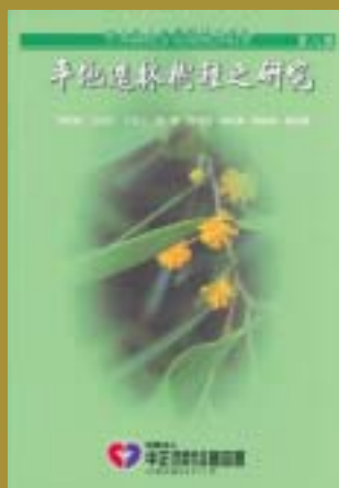
93-03平地造林樹種之研究(300元)