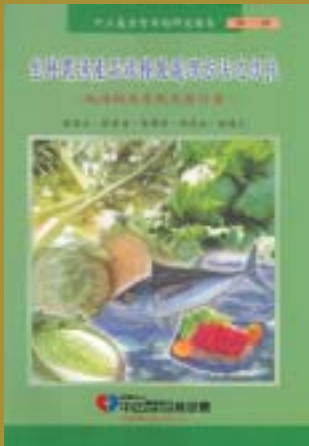
90-07-15生鮮農漁產品收穫後處理方法之改良—低溫物流系統先驅計畫