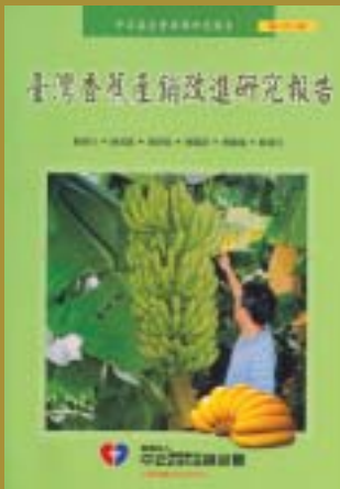
91-11-11台灣香蕉產銷改進研究報告