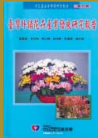
92-11-20台灣外銷花卉產業發展研究報告