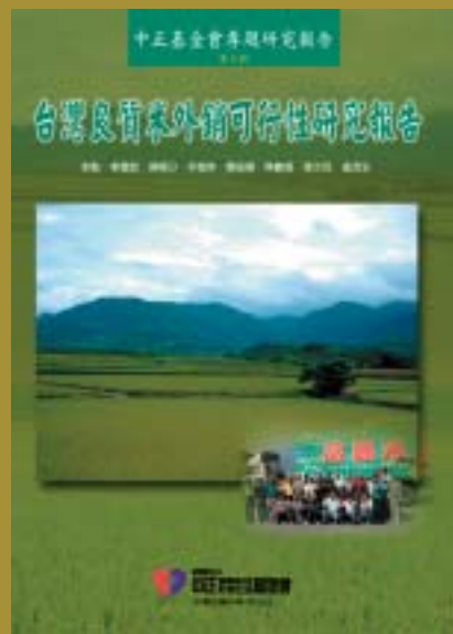
94-04台灣良質米外銷可行性研究報告