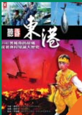
聽看東港從老漁村見識大歷史 葉志杰 著 360元