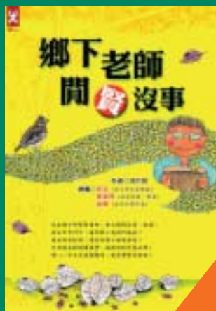
鄉下老師閒沒事 潘祈賢 著 200元