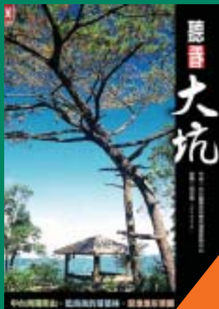
聽看大坑 中台灣陽明山 中台醫護技術學院 著 220元