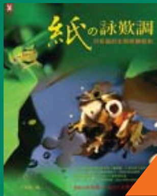
紙的詠歎調 洪新富的生態紙雕藝術 洪新富 著 350元