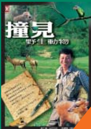
撞見野生動物 游登良 著 300元