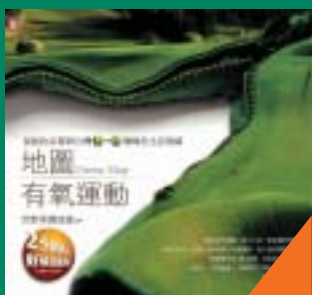
地圖有氧運動 風行全球Green Map 荒野保護協會 著 180元