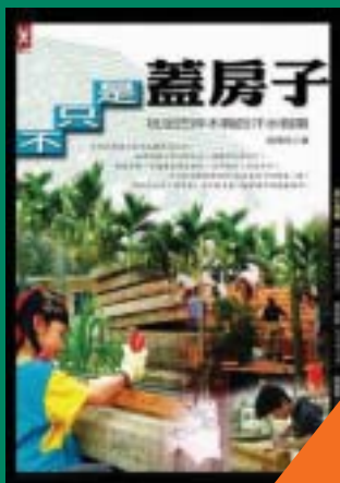
不只是蓋房子 玩泥巴拌木屑的汗水假期 胡湘玲等 著 220元