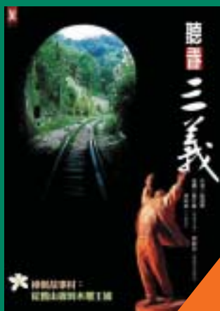
聽看三義 樟樹故事村： 從舊山線到木雕王國 薛淑麗 著 350元