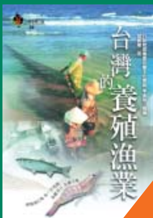
台灣的養殖漁業 胡興華 著 400元