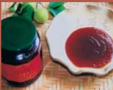
「喜覺支」特調的手工梅醬