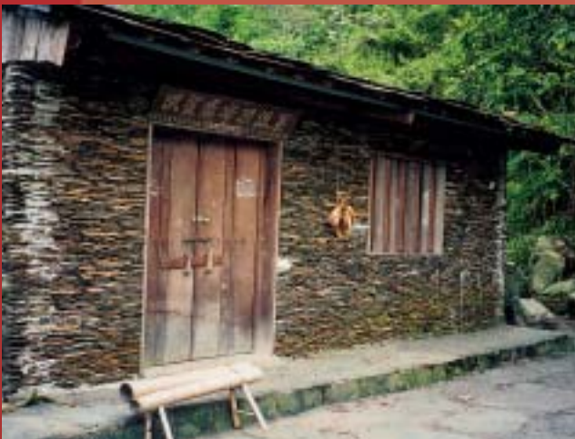
布農族傳統的石板屋