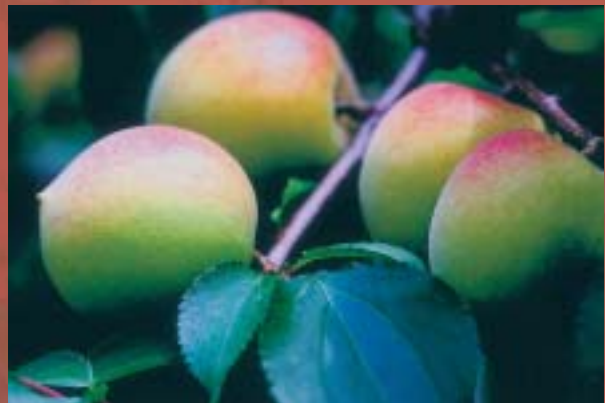
信義鄉栽種生產的胭脂梅