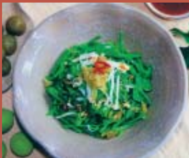
「喜覺支」創意梅餐料理－「梅汁涼拌蔬」