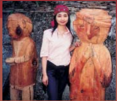
布農族的傳統木雕作品

築文化、傳統工藝（布匹的染色與編織、月桃編織、雕刻、陶藝等）、祭典習俗、狩獵文化、生活禮儀等，利用部落內的活動中心，設立布農文物