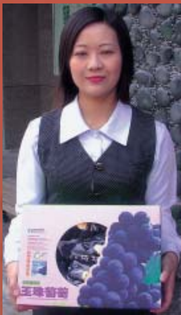
信義鄉栽種高品質的「玉珠葡萄」

信 義鄉結合高山溪流景觀、原住民文化、季節性變化自然景觀、農特產業等資源，形成全年多采多姿的農業旅遊勝地，尤其自新中部橫貫公路通車後，更成為阿里山、玉山、東埔溫泉等地，通往溪頭、集集、日月潭、廬山溫泉、清境農場等旅遊景點的中繼站。