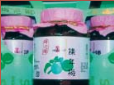
信義鄉農會食品加工廠生產的陳年梅

信義鄉農會採用「真」材實料，再配合完「善」的設備與技術，釀製成水果、穀類「美」酒，同時，搭配上設計精巧的酒瓶與包裝盒，使每一樣酒品達到盡善盡美的境界，尤其更為每樣酒品的特色，賦予一段肺腑感人或俏皮可愛的故事。外觀造型富原住民色彩的信義鄉農會酒莊，巍然矗立在新中橫公路旁，將梅子產業與農村休閒文化結合，以傳統產業文化為誘因，成功結合產業與休閒觀光之新經營型態。尤其在民間酒莊呈百家爭鳴的今天，信義鄉農會酒莊以成熟與豐富的釀製梅酒經驗和技術，再加上安排遊客導覽製酒過程、酒窖設施，結合布農族原住民文化的酒莊外型，漂亮完美的出擊，讓信義鄉成為「酒香」飄逸的「酒鄉」。