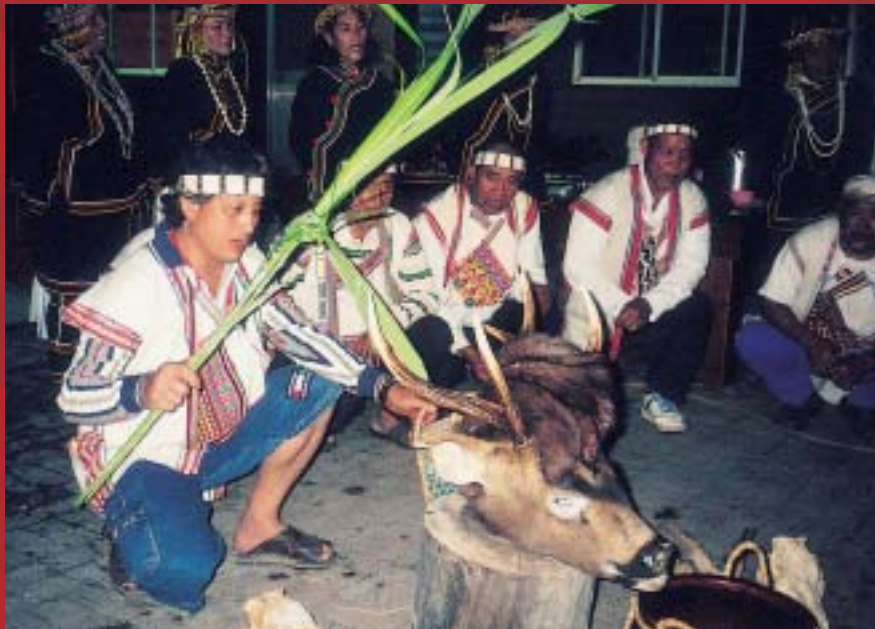
布農族傳統的狩獵祭