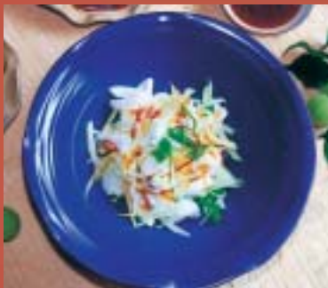
「喜覺支」創意梅餐料理－「梅味依伴」