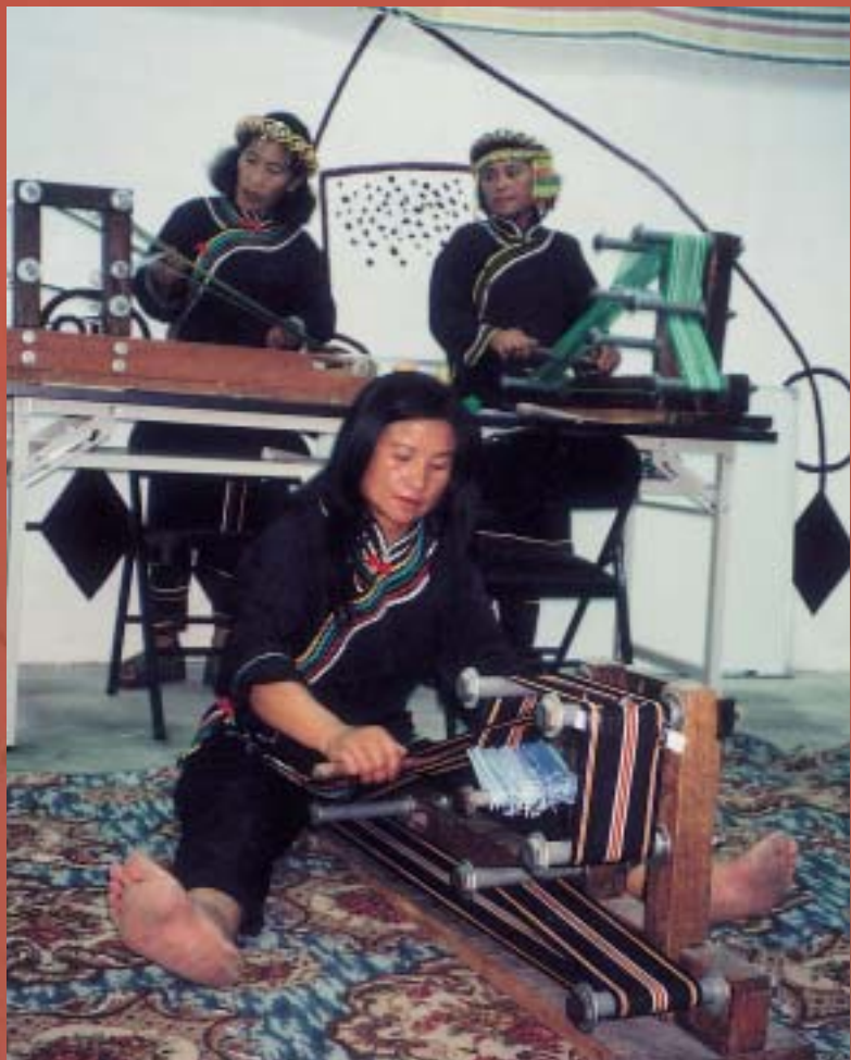
布農族婦女傳統工藝布匹編織

在有心人士努力的經營下，最近幾年來帶領著村民們，從事布農文化的尋根、收集、歸類、重建與傳承等重要工作，如石板（屋）建