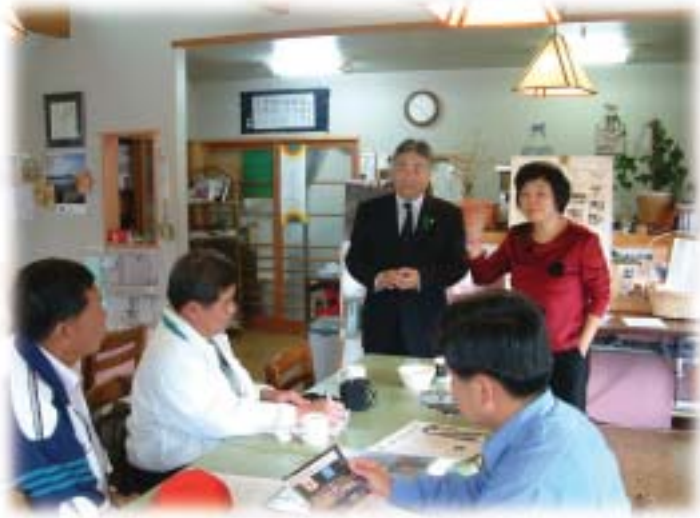
片品村長向我們說明該村的「綠羽毛」環保運動

小小的山頭就聚集了幾百棟的歐式別墅，也因此造成水源不足，路邊雜七雜八、大大小小的水管扭成一團，未經美化，就這樣裸露在眼前，還必須付錢請人隨時來巡邏，深怕被其他人將水管拔掉，屆時無水可用。前往渡假時還往往會聽到主人要求客人節約用水、要儲水，客人一到達聽到這樣的說法，就感到不能放鬆，每一滴水都要小心使用，萬一沒有水，又如何如何……，雖然內外環境佈置整理得還不錯，但光是這點（用水）就令人無法安心度假了。