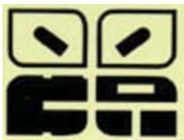
依據水芭蕉形象所做的片品村標誌

由於外子係德裔美國人，我們在德國還有很多長輩與親戚，所以過去幾年的暑假，我都會前往德國參訪，德國的農政官員告訴我，20多年前的德國正值高度經濟發展期，社會也普遍認同農業是被犧牲的產業，因此政府對於農業或農村發展，皆採「補助」政策。但政府統計發現，補助款愈多的村落或族群，抱怨聲愈大，沒有接受補助的，反而沒有怨言。