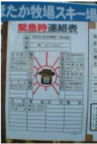
即使在最鄉下，工程施工的標示依然嚴謹到底