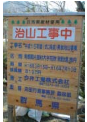
連總工程款819萬都需要人民一起監督品質

…等芝麻瑣碎小事，但大權依然控制在中央，鄉長連訂個亂丟垃圾罰則的權利都沒有，要怎麼自治呢？團員們看到片品村的自治情況，都欣羨不已，聽到現任村長是村內某家民宿老闆娘從別的村招贅進來的，便開村長的玩笑問說：「村內還有無機會可以招贅？有沒有限定外國人不能當村長？沒有的話，趕快告訴我們；村裡如果還有單身女子想招贅，當然要去排隊囉！」