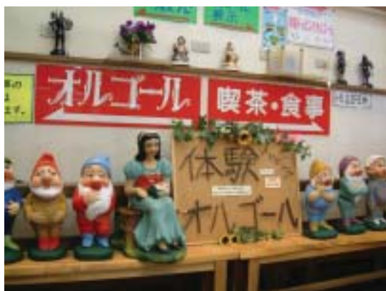
入村儀式—以音樂體驗盒來歡迎遊客

人，就已經是確定當選，此時，所有的競選經費與擾民活動會，都可以省下不做了。將這些資源轉而拿來建設村里、辦理各類公益活動。因為這樣的智慧，所以片品村這10幾年來，毫無紛擾，長治久安，和諧發展。因