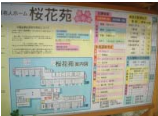
老人安養所的管理井井有條

於是片品村在真理呼女士的推動下，從12年前開始，每次村長競選時，事前便經過全村的協調，每次都只有一個候選人，因為只有一個候選人，所以出來的