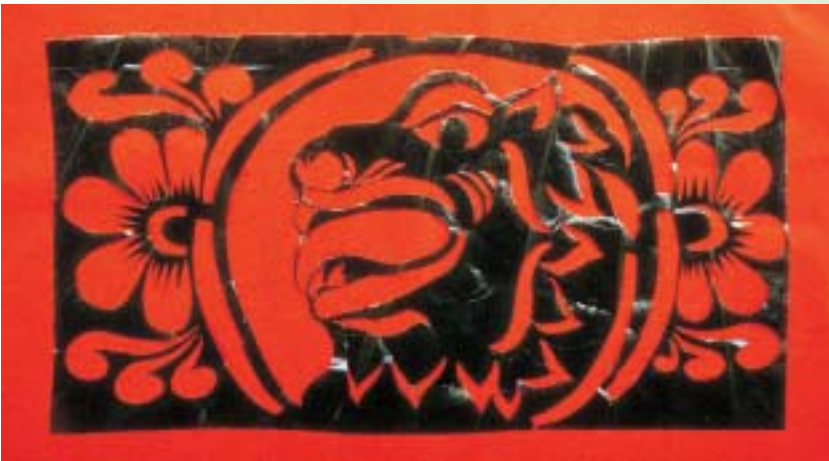
運用gok編製成結構複雜而華麗的藝術品