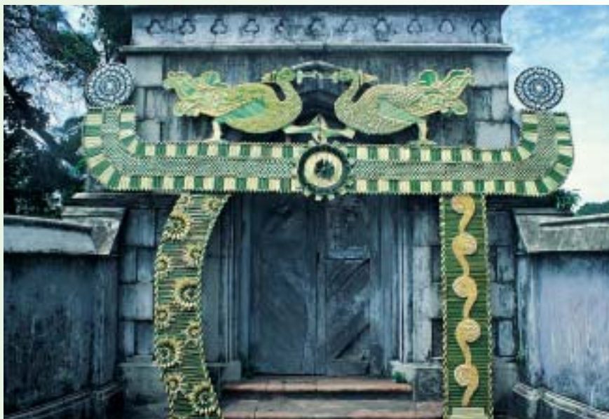
搭配木框門的托拉那(torana)

在街上到處可見椰子葉編製的花環、以椰子葉修剪做成的花穗、以及裝飾品，拱門上面以捲曲的柔軟椰子葉以及深色葉子裝飾；而在結婚台座的四週(又稱為波魯瓦 poruwa)放置椰子葉裝飾的瓶子，上面還放置