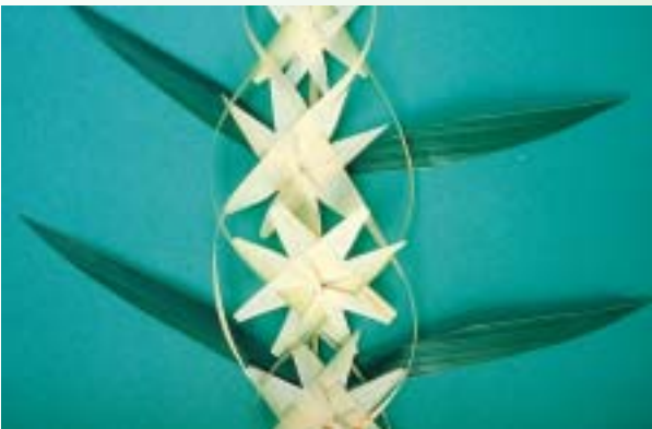
運用gok編製成結構複雜而華麗的藝術品

在空曠處設立高聳的托拉那(torana, 拱門), 但是這並不符合精緻雕刻的哥克(gok)葉子, 而竹棍做成的格子作品以椰子、露兜樹水果、旗幟進行裝飾。更常見的是, 托拉那(torana)會以木框組成(頂端的板子上面以獎章或圖像綴飾, 通常是鳥, 同時也包含兩個狹長的板子), 上面以哥卡拉環圈或緊或鬆地排成各種幾何圖形: 太陽、輪子、鳥、蓮花、黏土燈、藤蔓或是彭卡拉(punkala, 豐盛之瓶)。雙色的方格通常覆蓋著大方塊, 同時配以玻璃紙、褶邊的紙、手繪的圖像。摺起來圓錐狀的哥克(gok)葉片, 數量很大, 予人愉悅的感覺, 任何臨時註記的日期以及記號皆以穗帶或是檳榔花的葉片來製作。所有的幾何圖形表面皆以兩種色澤的哥卡拉來點綴。