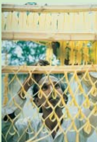
工藝師傅運用巧手與想像力，展現錫蘭民間特有的哥卡拉藝術