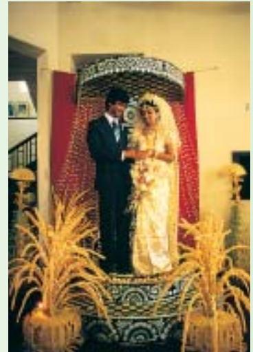
新人站在禮台上，接受祝福

無論是做成的花環及花穗、或是搭在棚架上的裝飾，或者是被做成木頭的框形成壯觀的波魯瓦(poruwas)、脫拉那斯(toranas)、或是