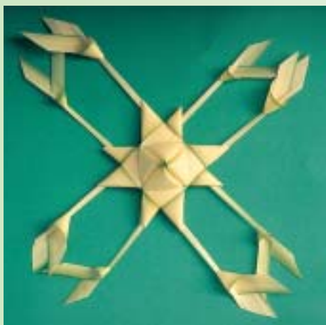
運用gok編製成結構複雜而華麗的藝術品