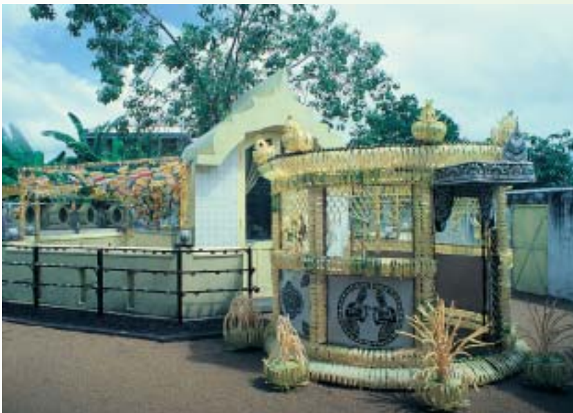
專業技術打造的「媿里斯門達八亞」(pirith mandapaya)