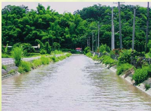
獅山大圳的水利灌溉系統，奠定美濃成為農業大鎮的基礎

高雄縣是選擇在美濃鎮的龍肚國小。提起美濃鎮，總不免讓人聯想到典雅精緻的油紙傘、磚紅色菸樓，還有全台唯一製作藍布長衫的老師傅。由於地位適中，四季氣候溫和，土壤肥沃，盛產稻米、菸葉、香蕉等作物，是台灣著名的菸鄉，也是高雄縣重要的穀倉之一，因此，由龍肚國小來舉辦「深度米食教育—看稻子長大」活動，顯得格外富有意義。