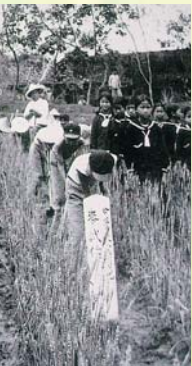
小農夫舉起右手宣讀誓詞