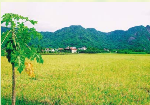
美濃鎮是高雄縣重要的穀倉之一