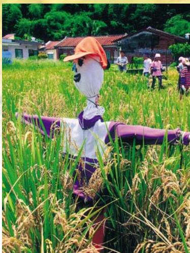
稻草人默默地站立在田中央，負起驅趕鳥群的任務