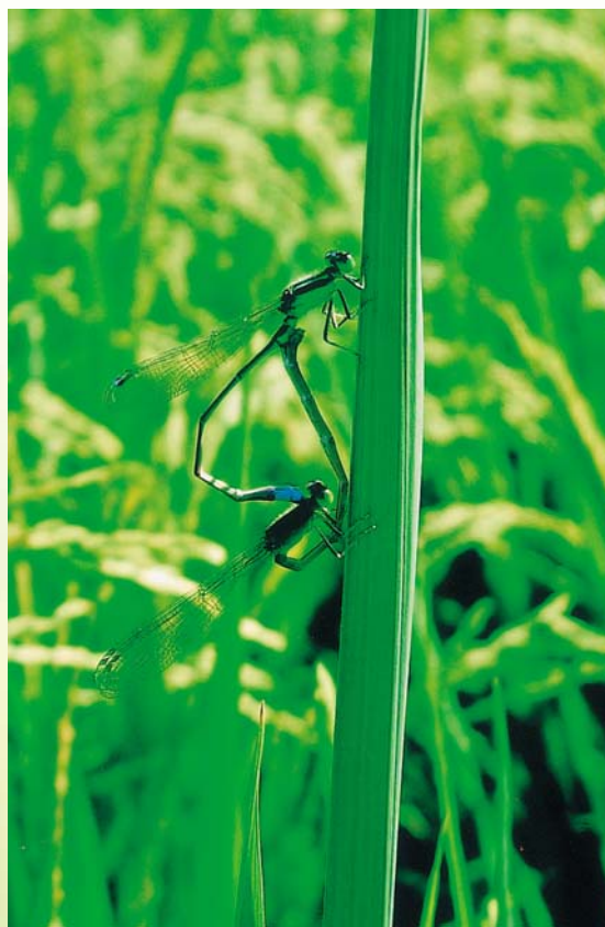
稻子的葉片上發現一對豆娘在恩愛

在陽光燦爛的6月天，結滿金黃色稻穗的稻田，有學童親自創作的「晴天娃娃」，隨著和風搖曳相伴，稻草人默默地站立在田中央，負起驅趕鳥群的任務，為美濃地區的農村景觀，帶來一股活力與溫馨的氣息，尤其在這難得一見農田景致的背後，沒有隱藏著農民的拘謹與憂愁，卻增添了孩子們的童真與歡愉。