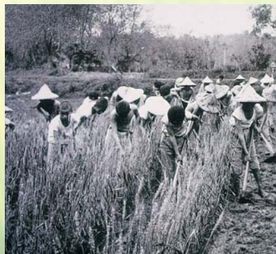
日據時期在龍肚國小增設農業補習學校