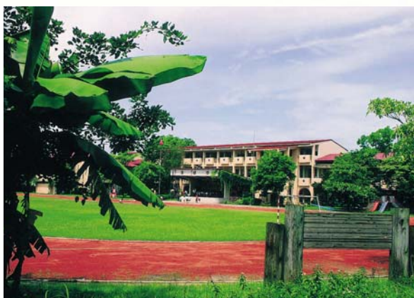
高雄縣美濃鎮的龍肚國小

為「瀾濃公學校龍肚分校」，位於龍肚庄落著名的茶頂山下，於日據時期的大正9年（民國9年，西元1920年）創設，除擁有人文薈萃的文化資源外，周邊還有豐富多樣的生態資源，所以，在日據時期昭和3年（民國17年），殖民政府即有意將龍肚地區作為農業發展的重點學校，就在校內增設農業補習學校，為當時台灣農業邁向現代化，培育了一批批的生力軍，時過境遷，遺留下近3公頃的實習農場，孕育了豐富的生態資源，現已成為學校的森林教室，是學童們編織童年夢想的所在。