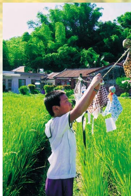
懸掛「晴天娃娃」 祈求老天爺天氣 放晴朗

2月17日，依照農業耕作節氣與習俗，當秧苗已成長到一定的高度，便選擇在春節過年後的2月17日，當天正巧是農曆正月初9日，為民間習俗中的「天公生」，小農夫們帶著自己培育的秧苗，到學校操場會合，再一起走到校園旁的水稻田，在老師與鄉親帶領下，小農夫們虔誠地祭拜天公與田頭伯公（土地公），請老天爺幫幫忙，讓這一期稻子在生長期間，能夠風調雨順，稻穀順利豐收。