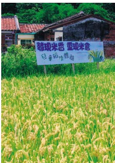
龍肚國小「發現米香.重現米倉」的兒童稻作體驗田

詞，待儀式結束後，熱心的學生家長，也是庄落裏的「資深農夫」，先下田示範秧苗要如何插播在水田裏，讓小農夫們大開眼界，見識到原來插秧是要倒著走，感覺到很新鮮和好奇，功夫也「很厲害」，輪到早已都市化生活，且從未下過田的小農夫們下田種稻，大家懷著雀躍的心情，以不穩定的步伐，踩進冰涼的水田裏，順著拉線做的記號，彎著腰插種下一株株秧苗，只是才播種一趟下來，童顏上已流滿汗珠，雙腳也沾滿了泥巴，才親身體驗到農夫真的很辛苦。