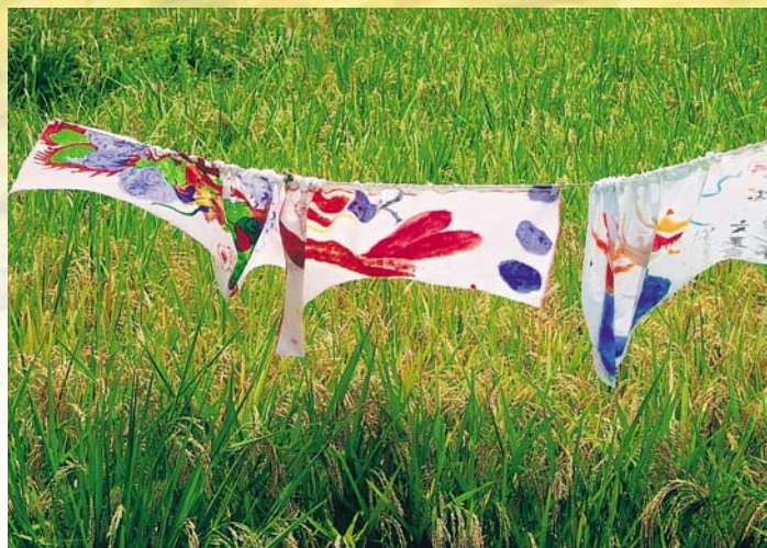
懸掛彩繪布幔也是趕鳥的好辦法

隨後由小農夫的代表，帶領小農夫們舉起右手，宣讀「我們愛這片土地，不使用化學農藥與肥料，…會竭盡所能照顧種下的秧苗，直到它們長大成熟。」的誓