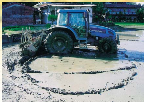
俗稱「火犁」的大型耕耘機來回整地

的師生們安排講習，隔天就分發糯米（五年級）與蓬萊米（六年級）的稻種，給參與的小朋友們帶回家培育秧苗。