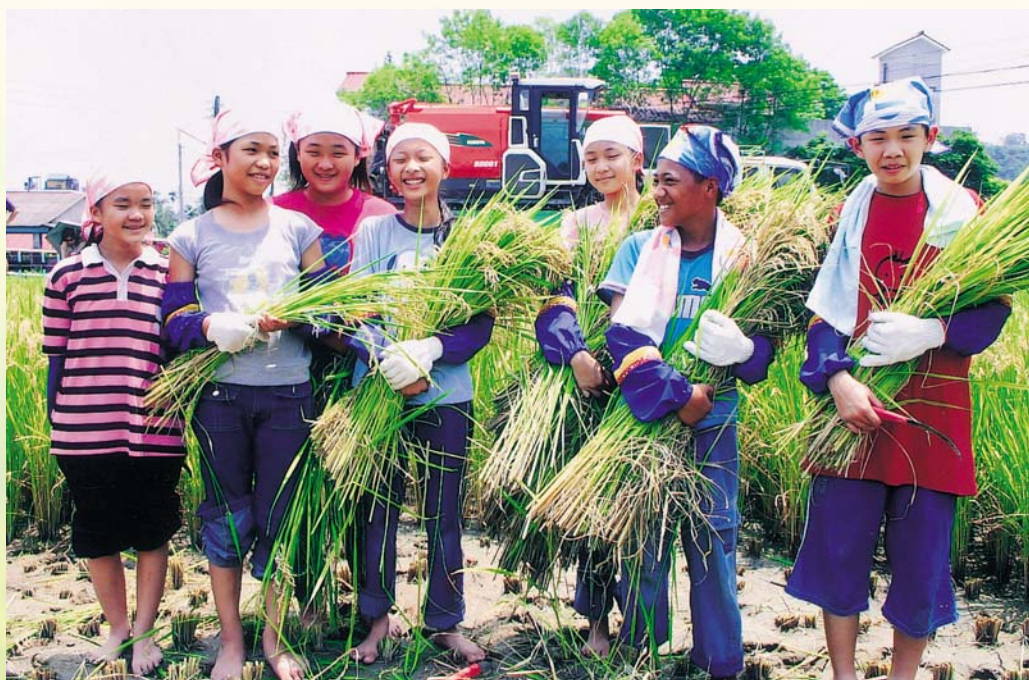
小農夫們同聲地說：「收割的感覺，真的很美好喔！」