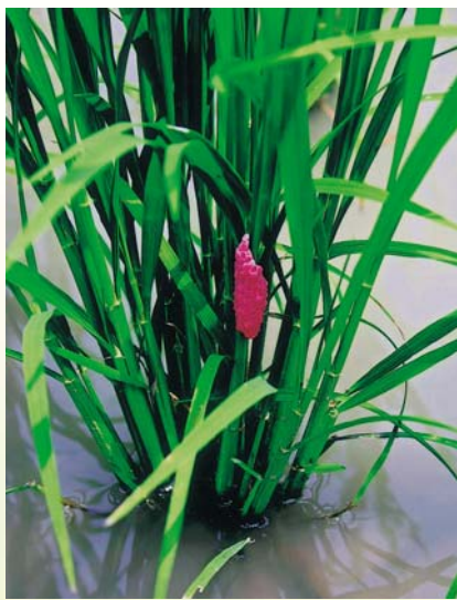
福壽螺在稻株上產下紅紅的卵