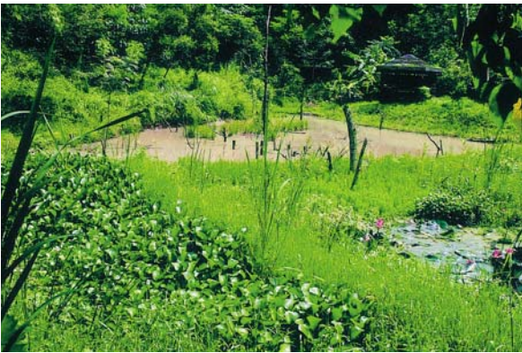
日據時期龍肚國小的實習農場，現已成為學校的森林教室