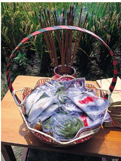
收割稻子前要在田頭擺上香案，供奉客家傳統的「板」來祭拜

我們愛這片土地，不使用化學農藥與肥料， 以及其他傷害土地的耕作方式，我們會竭盡所能照顧種下的秧苗， 直到它們長大成熟。