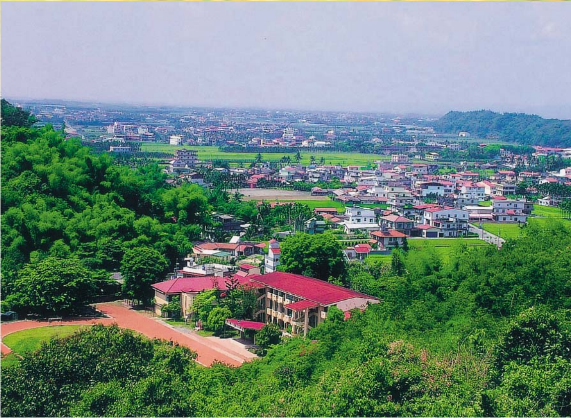
從茶頂山上俯瞰龍肚國小