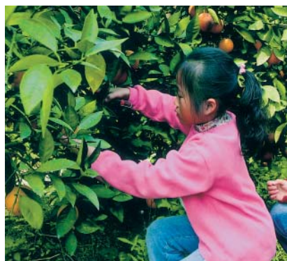
學童體驗親自採果的樂趣

劍門生態花果園（賴仲由） 彰化縣大村鄉茄苳村（路）2段141巷20號 (04)8522318 0933415950