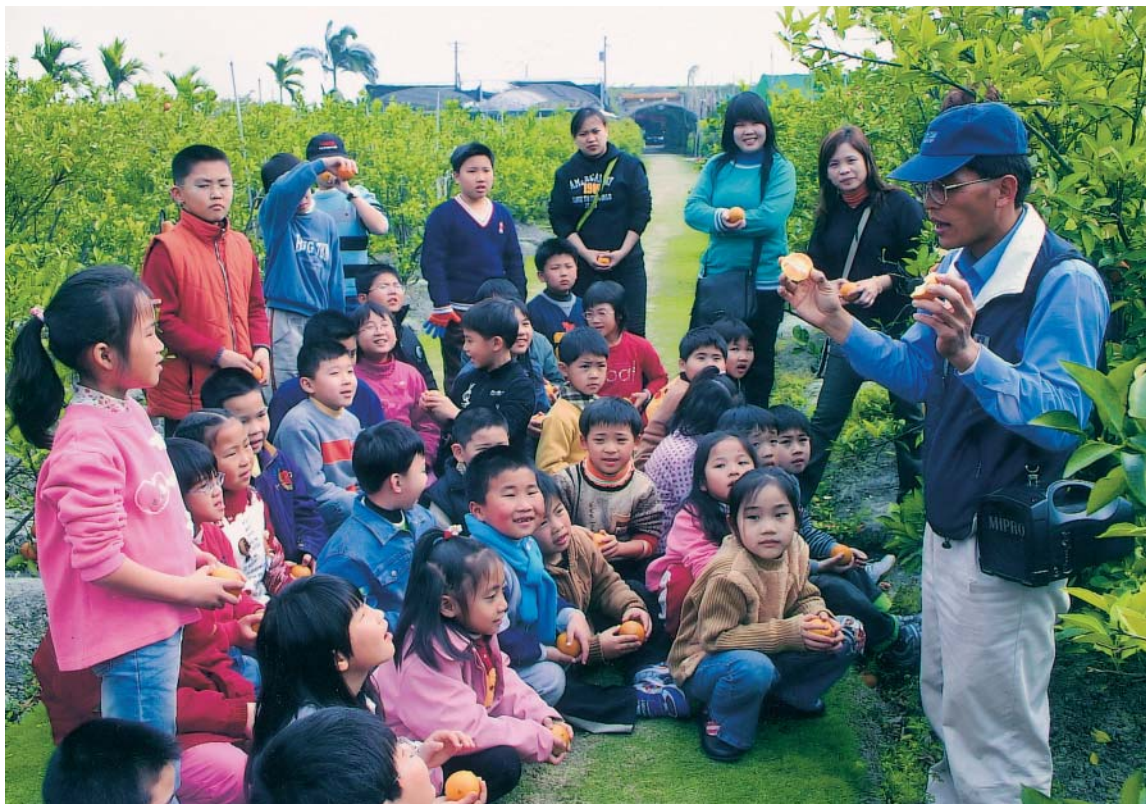
幼稚園學童最喜歡的校外教學場所

使教育農園能永續經營，達到「顧客滿意」、「員工樂意」及「經營得意」—「三意」的目的，因此，安排一次精緻深度的教育農園之旅，是要在一種很輕鬆、很愉快的心情下進行，為保護農園的土地資源，對遊客也是服務品質的保證，因此，對入園的團體實施人數總量管制，每天預約入園參觀或教學的人數，以不超過150人為基準。