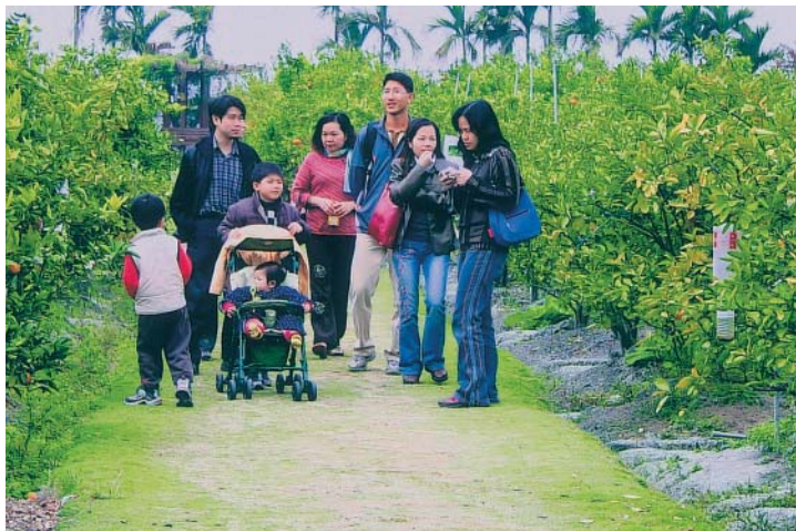
遊各們遊園帶來闔家親子互動的歡樂