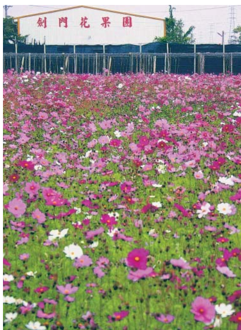
波斯菊花海中的劍門花果園