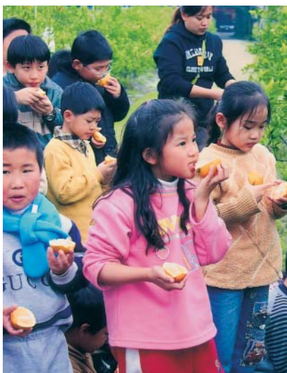
自己採的柳橙最香甜