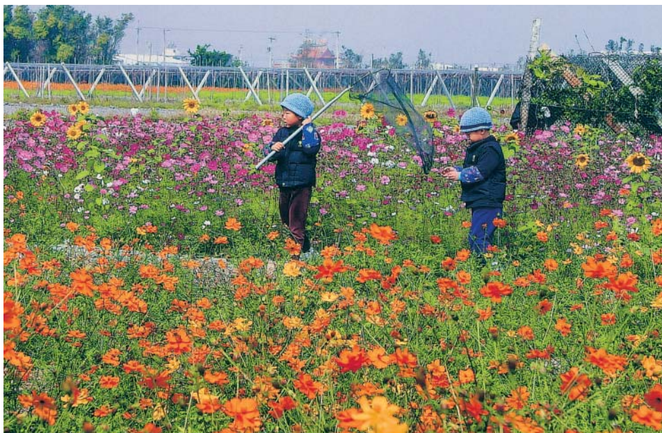
哥倆拿著捕蟲網遊園捕蝶

生態花果園早期以農業生產為目標，到賴仲由這一代，因面臨WTO的壓力，除將既有的柑桔品種多樣化、精緻化外，更將一小部分約1.5分地，規劃作為學習教育區，設有簡易蝴蝶網室、兩棲類網室、家禽網室、水生植物生態網室，以及教室、休憩區等設施。賴仲由表示，遊客來到果園，不只是採好吃的水果，還可以在柑桔園區，聽到精采詳細地解說，觀察到許多珍貴的生態景觀，如蝴蝶、青蛙、甲蟲、螢火蟲、鳥類等，許多遊客在看完及聽完解說後，才赫然發現一個柳丁的背後，竟然蘊