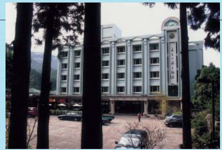
「孟宗」是台灣擁有觀光飯店水準設施的休閒旅館