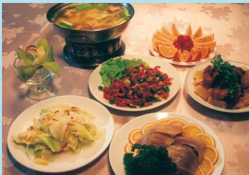
孟宗主廚精心調理的在地風味餐點

山莊廣場旁的銀杏林露天吧，備有簡餐、咖啡與茶藝，邀您共享孟宗（夢中）之美，尤其夜晚邀約三五好友，或與心愛伴侶憑欄共賞星月，勾起溪頭夢鄉之回憶。與大自然環境相融合的庭園香草咖啡吧，提供香草、咖啡及養生套餐服務；或躺在森林吊床，在藍天綠樹陪襯下，抬頭仰望綠樹藍空，放眼盡是翠綠嫣紅，晨午聽悅耳鳥唱蟲鳴，傍晚看祥雲彩霧同舞，夜晚觀滿天星月爭輝，一天