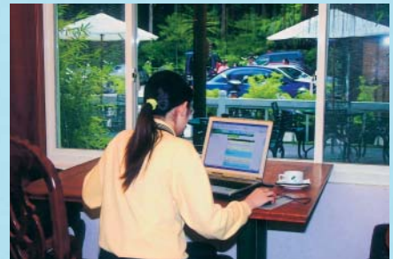
孟宗提供咖啡廳無線上網服務