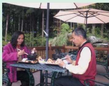
孟宗華陀養生御膳餐