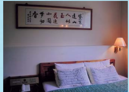
孟宗竹炭養生套房