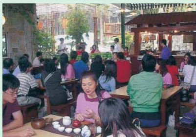
茶與音樂饗宴活動