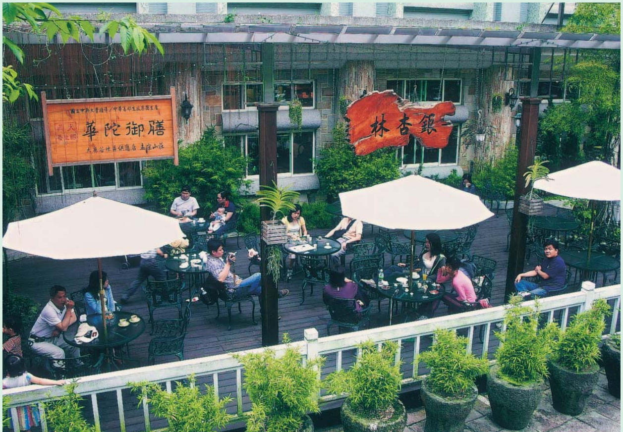
廣場旁的銀杏林露天吧