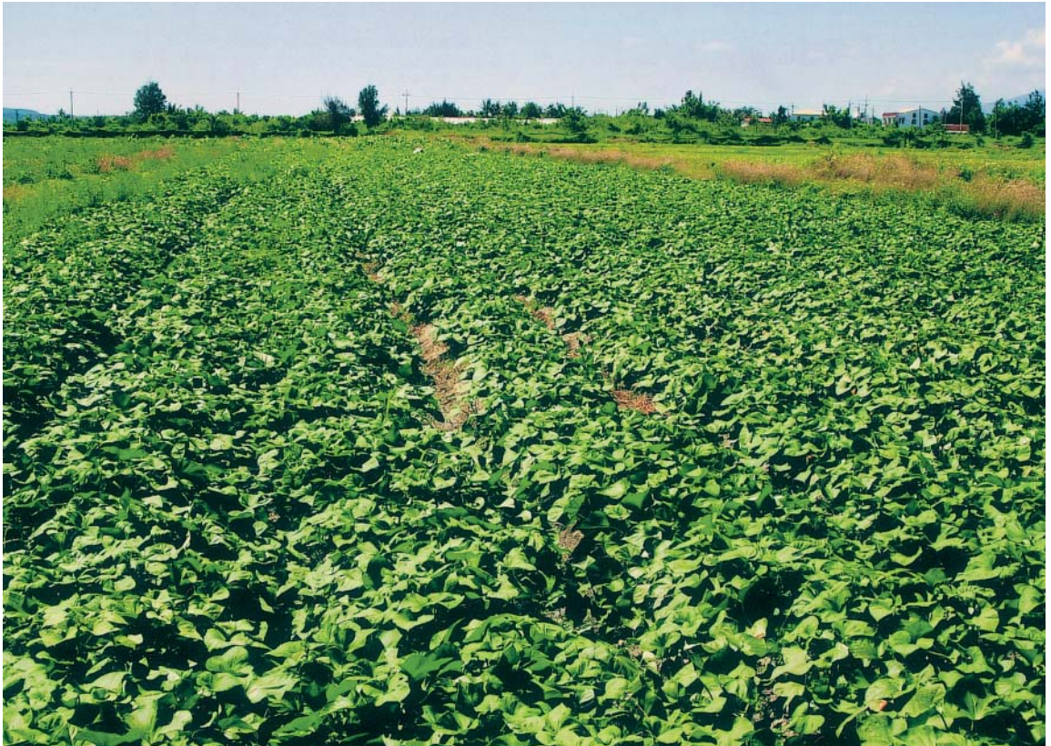
旭日有機農場的有機甘藷田

高升，進入梅雨季節後，連續豪大雨常會導致農田排水不良，影響甘藷生長，不易結藷，所以，6~9月是甘藷的淡產季節。