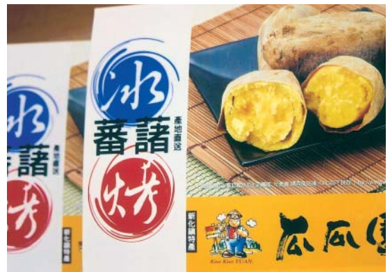
瓜瓜園品牌的冰烤甘藷

甘藷的吃法有很多種，烘、煮、烤、燻、炸，無不香噴可口，令人垂涎三尺！近2~3年來，市場上最受消費者歡迎的是烤甘藷，尤其是台南縣新化鎮農會食用甘藷產銷班研發出來，冰熱皆適宜的「冰烤甘藷」，現已成為市場寵兒，不僅國人特別鍾愛，連