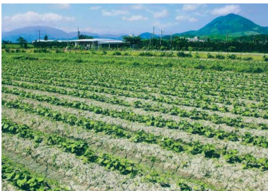
分批陸續種植甘藷種苗來延長產期

甘藷為藤蔓根莖類作物，生長時需要的土壤，黏質、砂質土壤各有其優劣點。如栽植在砂質土壤裏，甘藷的生長期較沒有阻礙，藷條的外型較漂亮，生長速度也較快；如果是要求口感與香味，則以黏質土壤較好，但剛栽種時，若土壤耕犁不夠深，土壤不夠鬆散的話，一旦碰到淹水，土壤層就容易結塊，當藷條成長時遇到阻礙，即會變成紡錘型，像似團球狀，雖然外觀略遜一點，然口感上卻較好吃。