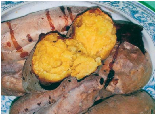
烤甘藷的表皮裏滲出濃濃的糖汁