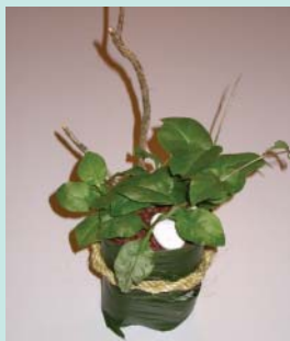
將樹枝加在花器內有助於川七攀爬