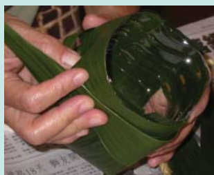
空寶特瓶用葉蘭葉作包裝