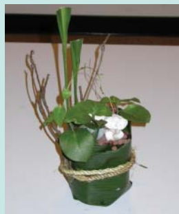
這是一盆有生命的花藝設計作品