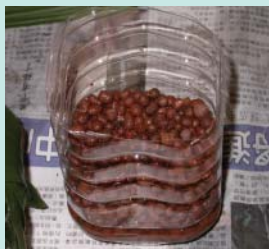
底層放發泡煉石有助通氣性