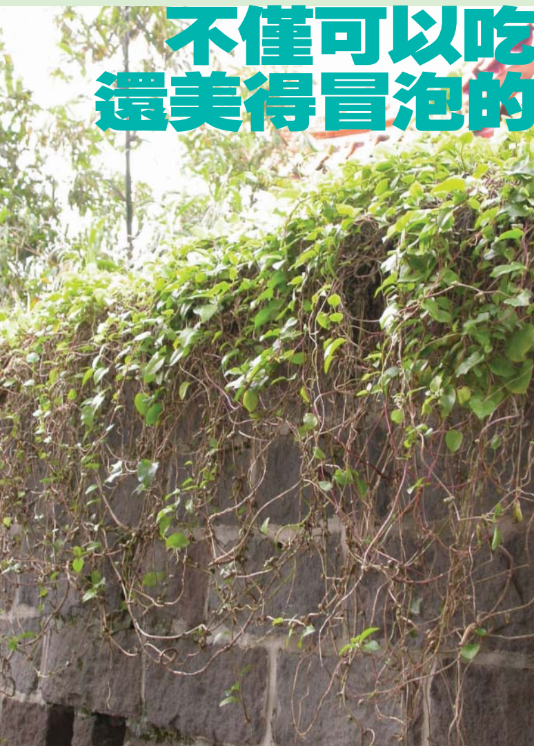
川七爬成自然的窗簾

好多川七， 真美！ 「川七很好種，插枝就可以活。」 「可以跟你要一些回家種嗎？」 「當然可以，你自己拔，枝幹拿回家後插在土裡2~3星期就會長出新葉子。」 山上摘的川七葉子又綠又厚， 回家扦插長出的卻是__的綠色， 也一樣美極了。