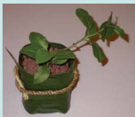
將川七種入花器內，再以麻繩綁在花器上作裝飾