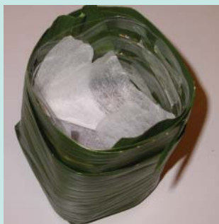
發泡煉石上面加一張不織布後放入培養土