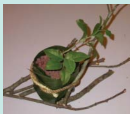
加幾枝樹枝一起擺飾又是不同的風味