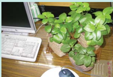
川七庭園讓辦公桌上生氣盎然