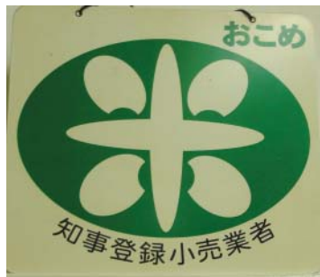
米要經過「八十八」道手續

在所長的一席話中，我們才知道，原來這樣的稻作系列體驗活動，在全日本農會中，受到日本農林水產省的肯定、指導、宣傳並補助訓練經費的，只有兩家，關東地區是新瀉縣六日町的南魚沼農會，而關西地區就是近畿地區篠山農會。從開創至今，他們已邁過12個年頭，每年舉辦3次活動，分別是：插秧、除草施肥，以及割稻，每年度參加活動的總人數從一開始的幾十人，到現在約有600~1000人左右，