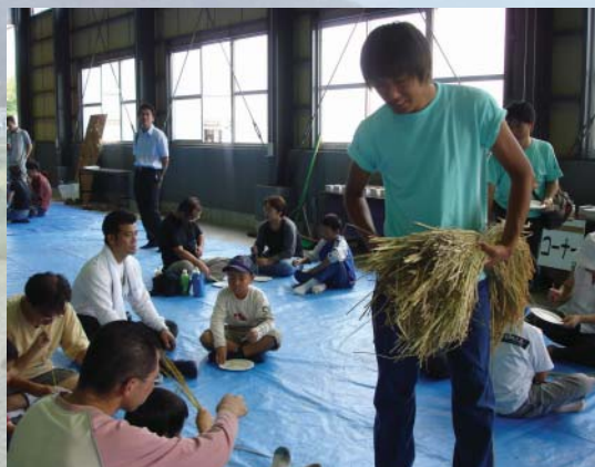
來來來！每人一把稻穗，不要多拿