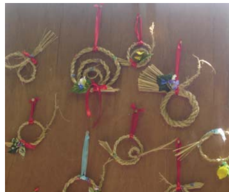
日本稻草吉祥作品

一整天的活動，就如同預計行程表所寫，準時在下午3點召開「結業式」。主持人先是以簡單的問答炒熱氣氛，如：吃哪一種米最為營養？做麻糬的是哪一種米？今天午餐時所吃的牛肉是哪一品種的牛（有為當地篠山牛打廣告之重嫌）？問了5-6題後，便邀請當地的稻穀研究所所長上台致詞。從上、下午的問答遊戲中，我觀察到，其實不一定要有實質的獎品，也可以讓每個人玩得很快