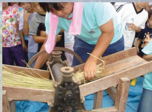
古代的稻草柔軟機