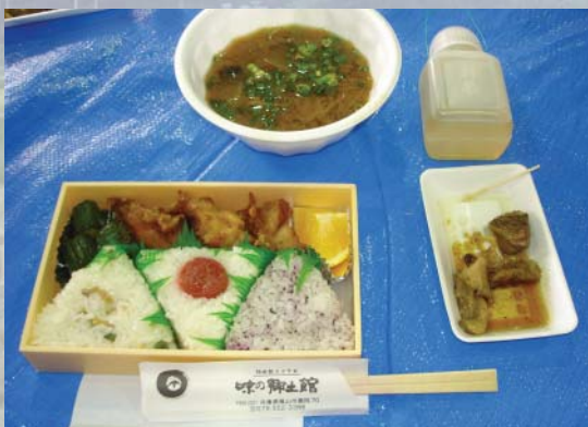
三色亮麗飯糰、筱山牛肉、熱呼呼的湯，還有茶