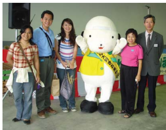
所長和「米飯君」特別感謝東吳團隊不遠千里來割稻

員與「米飯君」一字排開，正揮著手向大家致意、送別呢；當遊覽車駛遠了，仔細瞧瞧，仍可看見那小小的人影站在廣場裡目送大家，說不定拿望遠鏡來看，你仍會看到他們揮著手呢！