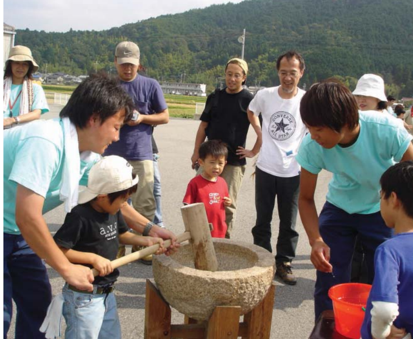
要吃好吃的麻糬，就要用力

子，心理上對於大自然、鄉下有莫大的嚮往，可惜，日本鄉下人也不太知道，鄉下真正吸引都市人的是當地的文化、特色，反而學習起都會的咖啡廳、餐廳，來迎合都市人的口味，丟棄自己的文化、特色，以為學習都市就是進步，卻忽略了真正珍貴的「財產」。