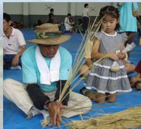
看我空手編草繩，會了嗎？