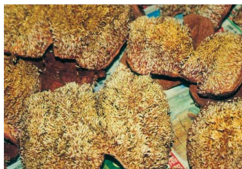
採取有機栽培生產的愛玉子