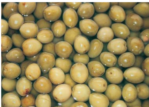
梅園生產的有機脆梅