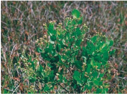
在海濱地區才看得到的鯽魚膽植物