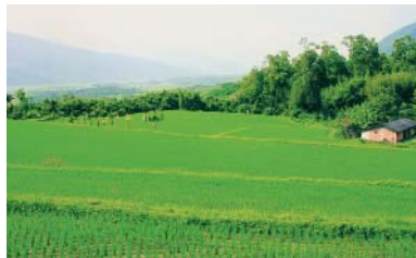
羅山村內的梯田是花東縱谷十分出色的田園景觀

行政院農委會花蓮區農業改良場從民國91~92年間，在羅山村進行「有機農業村」的可行性調查評估，認為羅山村具有全面發展有機農業的潛力。經過在地的行政、農業機構及500多位村民們的認同，共同組成羅山村有機農業發展委員會，建構成為台灣第一個有機農業村，目前，全村栽培70公頃的稻米，已全部通過有機米的認證，此外，果樹與畜牧業部