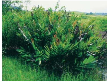
列為保護對象的鹵蕨