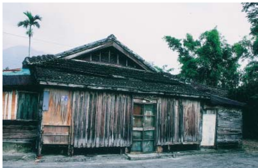
「醫生的家」日式建築民房