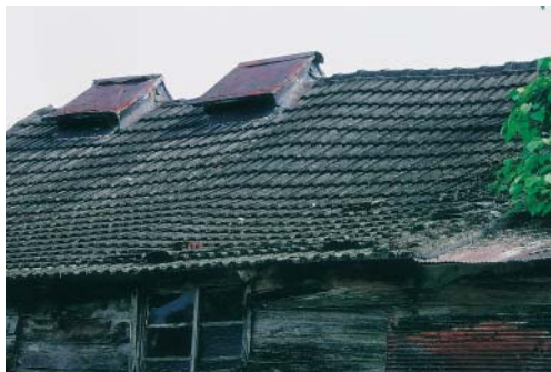
台灣較少見的「廣島式」菸樓