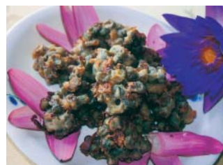
養生蓮花餐－酥炸蓮花球

而「富麗漁村」是花蓮縣政府選定「一鄉一特產」的風味美食餐廳，由曾任教台灣觀光專校中餐老師，持有乙級中餐證照的女主人，親手料理製作無毒養生風味美食，所創作獨特的「養生蓮花餐」，如「涼拌蓮花梗」、「酥炸蓮花球」，就是用蓮花的蓮梗作為食材，再以桃紅的蓮花瓣作為妝點盤飾，色、香、味俱全，一道道都是別具風味的美食，等著您前來嚐鮮。