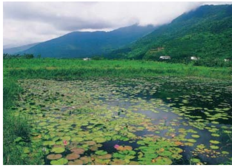
大愛農場的蓮花塘