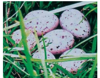
紅冠水雞在蓮花塘畔草叢下築巢生蛋

陳威良(大愛農場)花蓮縣壽豐鄉豐山村漁塘路36號 電話：(03) 8653-808 0928-875538