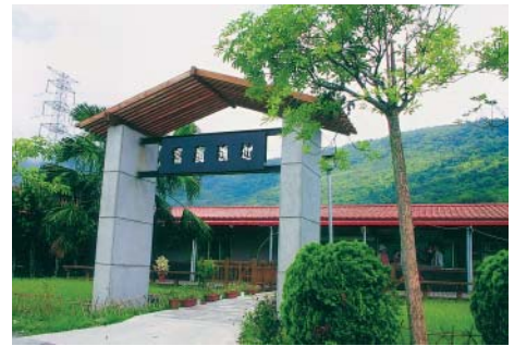
富麗漁村美食餐廳