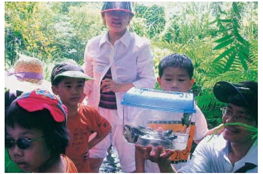
親子體驗生態之旅

為一棟瓦頂魚鱗板的日式建築，是日據時代豐田移民村的醫療所。房舍入口的玄關，及造形特殊的「鬼頭瓦」，讓這棟建築顯得格外引人注目。豐裡國小斜對面的中山路旁，有一棟日據時期的警察局遺址，方正的建築物外觀，仍可感受昔日高聳的威權。日本警察在當時台灣人的眼裏，代表了紀律與權威。在豐裡國小對門的這棟破舊瓦屋，就是當年豐田移民村的警察官吏派出所。最近幾年間，此棟建築物於得到政府撥助經費後，現已整建為豐田公民會館。