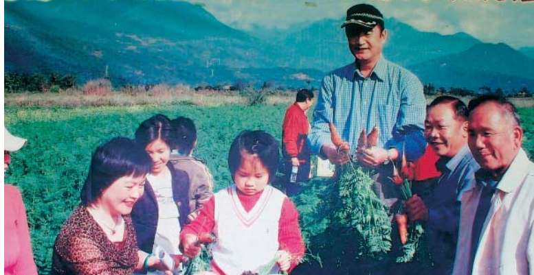
農場餐廳加入花蓮縣政府推動「無毒大聯盟」餐廳行列

育多種稀有蛙類，農場的濕地生態池，已積極展開復育工作，如今已成功復育出貢德氏赤蛙、小雨蛙、澤蛙等約10種蛙類，經常在晨昏之際，群起鼓譟爭鳴，譜奏出自然界的田園交響曲。