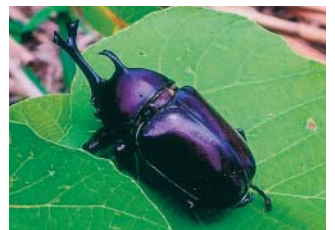
很受小朋友歡迎的獨角仙