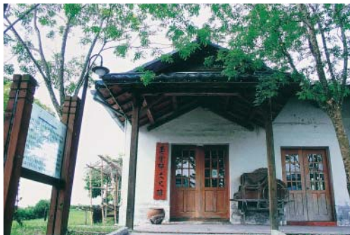
警察官吏派出所已整建為豐田公民會館