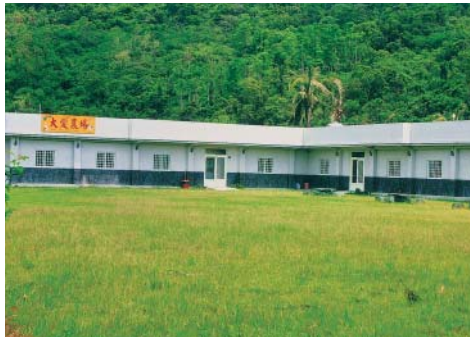
背依著中央山脈的大愛農場