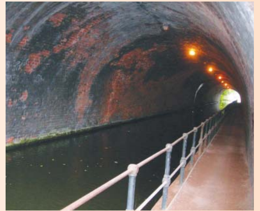
隧道內走道狹小，寬度僅容一人騎單車經過

長約數哩的楓樹步道，在初秋開始換裝，水道上偶爾有遊船經過，遊船安靜的在運河上劃開水線，乘客在布置豪華的船上享用美食。雖然走道僅2米寬，但是腳踏車代步的人亦不在少數。遇到迎面而來的步行者或是擦身而過時，通常人們都會禮貌的打招呼或寒暄幾句，也因此雖然在寒意甚濃的初秋行走時，感覺很溫情。