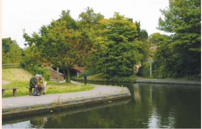
從伯明罕大學往市中心的步道有一個休息據點