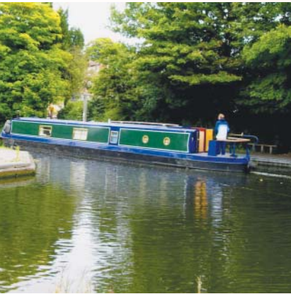
載運旅客欣賞河畔風光的船隻，供應美食紅酒