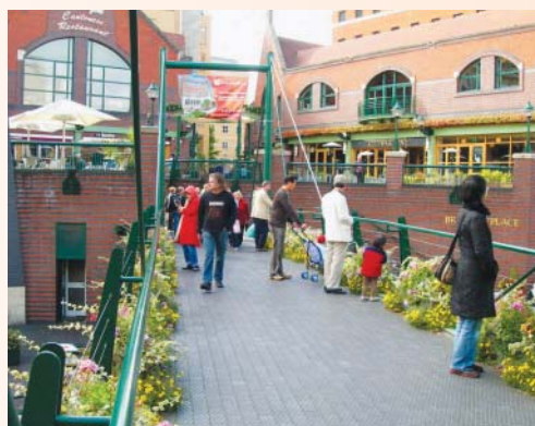
各國風味的餐廳，很能吸引人潮