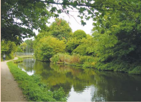
還帶有盛綠的植物，已透出秋天的腳步聲