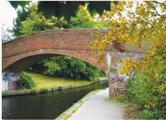
河畔有許多出口，通往各小鎮和公園