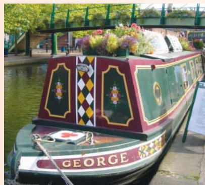
外觀普通，內裝設備樣式吸引人的餐廳