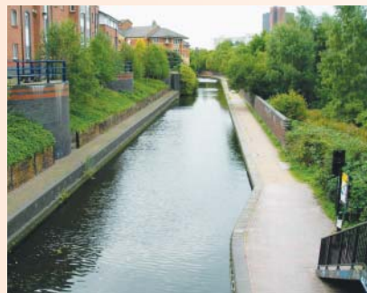
漸近市中心建築物多了起來，顏色配搭很融合

Maple Canalwalk是其中一條長約數哩，寬僅8公尺左右的人工運河，河畔盡是楓香槭樹，自伯明罕市中心開始展延，貫穿了伯明罕植物園、伯明罕大學、幾十個歷史價值的公園。它的開發和管理，是由英國水道局、伯明罕市政府和伯明罕大學共同維持。最著名的即是沿著河畔