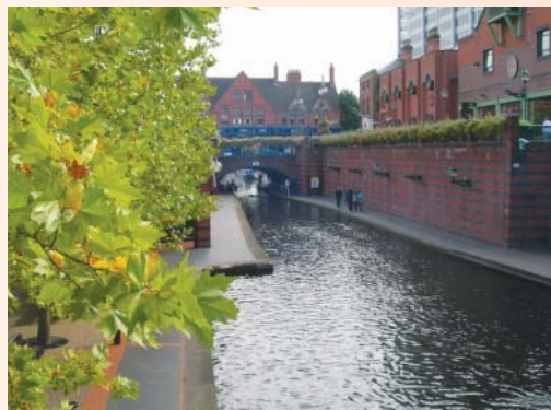
河道在市中心部分較寬敞，種滿變色植物

長約數哩的楓樹步道，在初秋開始換裝，水道上偶爾有遊船經過，遊船安靜的在運河上劃開水線，乘客在布置豪華的船上享用美食。雖然走道僅2米寬，但是腳踏車代步的人亦不在少數。遇到迎面而來的步行者或是擦身而過時，通常人們都會禮貌的打招呼或寒暄幾句，也因此雖然在寒意甚濃的初秋行走時，感覺很溫情。