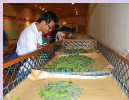
參觀苗栗農改場蠶業文化館

污染和破壞。台灣地區原本土地面積窄小，觀光資源極為有限，一旦被破壞後即無法再生，所以推展精緻的有機知性之旅，將一般人所迫切需要的健康意識融入休閒農場旅遊、渡假休閒的經營理念中，使人們透過旅遊休閒的過程中，將完整性、教育性、知識性與生活化帶入其中，一方面可享受真正休閒度假的樂趣，一方面又可獲得真正「有機」的概念，回到原有生活、工作崗位之後，做起事情來得心應手、信心十足，更生了「生」活「機」能外，對於國人的健康意識及自然生態的促進，亦有了潛移默化的作用。