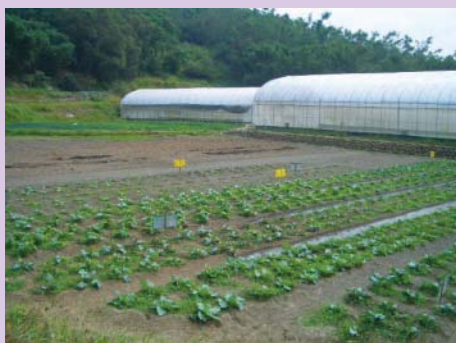
城南有機農場露天菜園