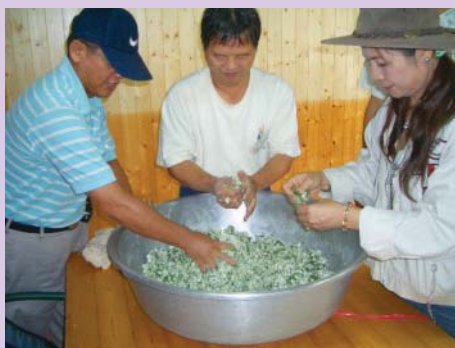
體驗艾草包製作之二