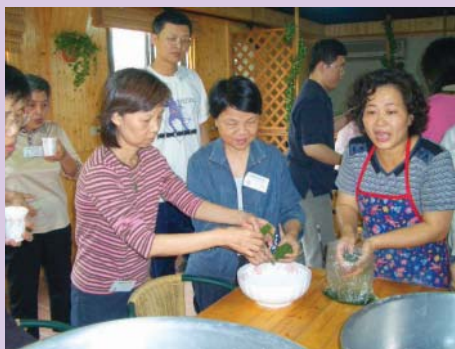
體驗艾草包製作之一

來到第一站「城南有機農場」，這是個科技人爲了自己以及下一代健康而投資經營的農場，原本只是自給自足，種植供給自己食用的