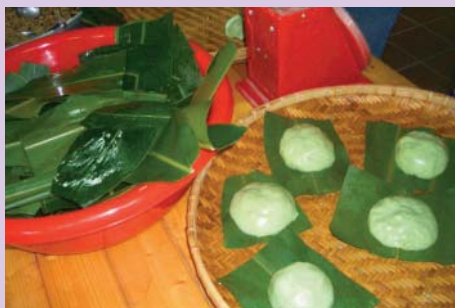
第一次自己完成艾草包製作，滿心歡喜

有機蔬菜，到現在可以有餘的提供給一般民眾訂購，顯示「有機農業」的投入雖然辛苦，但是只要有心、用心，假以時日，當受盡化學農藥以及化學肥料破壞的土地休養調節過來，當我們的環境達成自然協調的狀態，享受自然健康的食物以及環境並不是一件難事。在「城南有機農場」大家體驗了親手製作艾草包的樂趣，從剪月桃葉、撕艾草、揉麵糰、包餡到使用古早的灶來炊煮，對於生活在都市中的城市鄉巴佬來說，著實是一樁難忘的經驗。接著參觀農場的各式有機蔬菜栽培，由於不使用化學農藥，所以菜園中利用黃色的粘蟲板來除蟲，而人工除草的痕跡也可以在田埂旁隱約發現。中午一行人在農場餐廳中享用有機餐，新鮮甘甜的有機蔬菜、輕爽無負擔的少油少鹽料理，再加上肉質Q嫩的放山土雞肉，雖算不上山珍海味，但真是美味健康又營養的一餐。