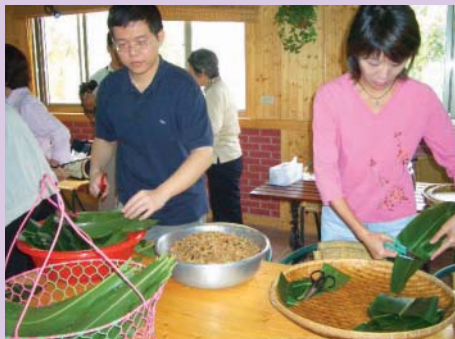
剪裁用來襯底的月桃葉