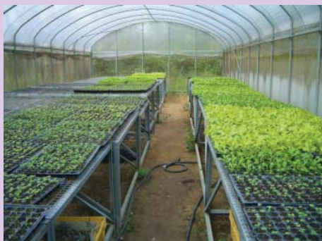
城南有機農場育苗場