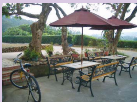
城南有機農場休閒景緻