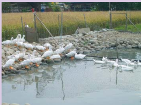
合鴨是鴨間稻成長的好幫手