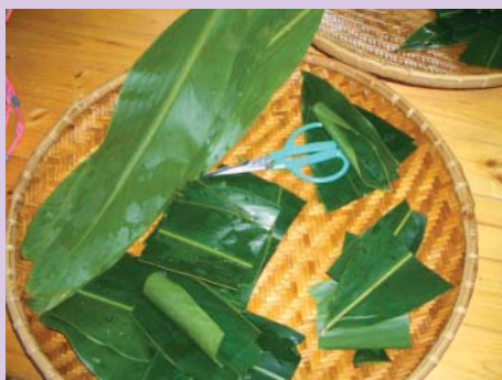
艾草包利用月桃葉襯底增添風味