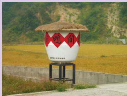
山水米鴨間稻場之一