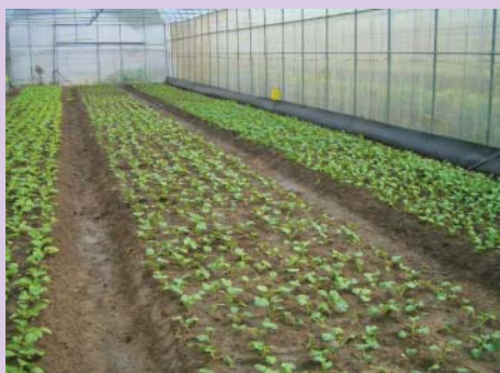
城南有機農場溫室蔬菜栽培區