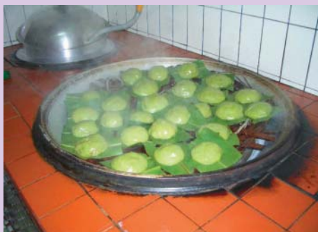
蒸熟後的艾草包令人垂涎

以往傳統觀光旅遊事業，是破壞自然生態環境資源的產業，尤其是農村產業；大批觀光旅客湧進所謂觀光勝地，雖然替當地帶來了些利潤，但也帶來了