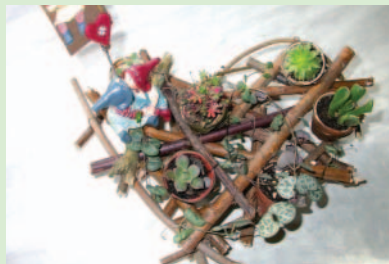
7. 小小一棵棵的多肉植物，利用葉蘭葉將不好看的塑膠盆包起來