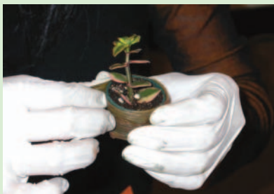
5. 作出一個心型後，用同樣方法再作一個心型