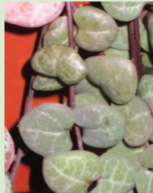
9. 讓愛之蔓自然的攀緣在心型的樹枝架上