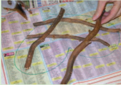
1. 在報紙上畫出一個心型