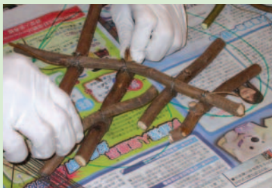
2. 將樹枝作斜十字交差排在心型內