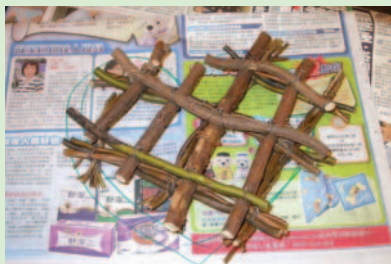
4. 將超出心型範圍的樹枝剪掉