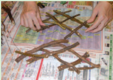
3. 斜十字交差處用鐵絲固定