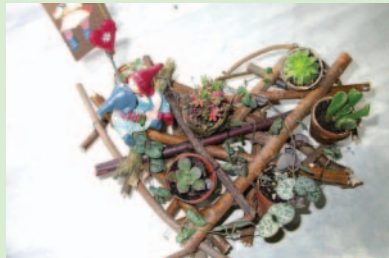
8. 葉蘭葉包好後的一棵棵小小植物，利用鐵絲固定在心型的樹枝架中