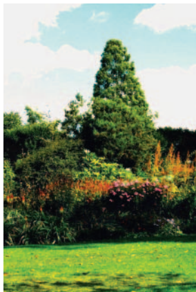
時值初秋樹木已見黃紅一片