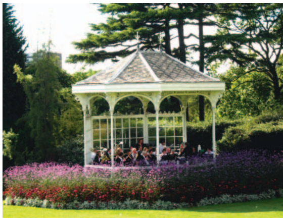
每週日的戶外弦樂演出