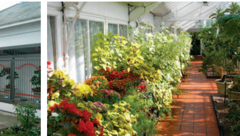
地中海型氣候區植物