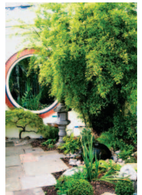
結合中日式的門面風格

園區的3座溫室已有150年歷史，室內主題也分成熱帶、亞熱帶、地中海型和沙漠植物。展示植物多由國際間交流互換而來。有不定期的培訓課程提供盆栽文化、知識等。園區另設有教育中心，每週中、週末辦理成人和小孩各式各樣的專業課程，園藝、瑜珈、造景、數學、地理等應有盡有。