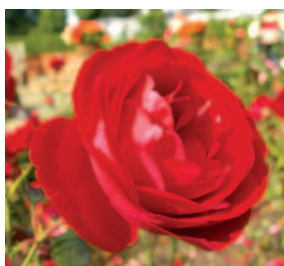
玫瑰園內的花卉多已凋謝，少數仍在開花