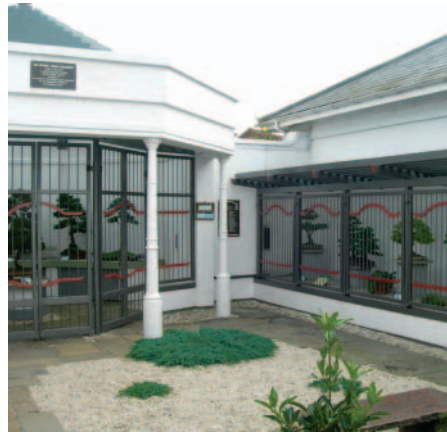
國家盆栽收藏中心展示櫥窗