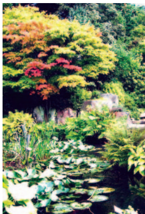
戶外景象色彩繽紛

伯明罕植物園小而精緻的特質，加上居民的人文素養和熱愛自然的品德教育，展現成熟的都會文明。