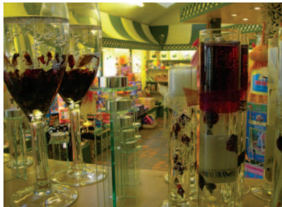
精緻的訪客中心販售園藝加工品