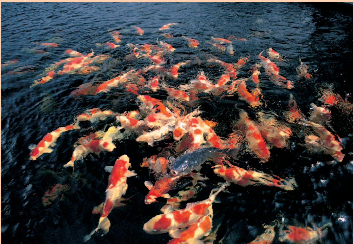
賞魚者讚賞錦鯉為水中「游動の寶石」

錦鯉身上不同的斑紋，是由紅、白、黑、黃、淺藍、金、銀等多種顏色所組合而成。而觀賞用的鯉魚，生性合群溫馴，色彩艷麗，身上的斑紋每條都不一樣，模樣千變萬化，在水中悠游時，像是一顆會游動的寶石，隨著水流浮沉，令人賞心悅目，因此，觀賞者常以水中「游動の寶石」稱之。錦鯉的壽命可以長達數十