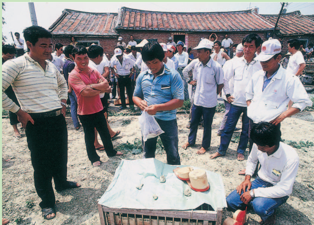
當地農民非常熱衷於放鴿苓的農村休閒活動

學甲鎮頂洲、紅茄二里的「賽紅腳苓」，據傳是起源於100多年前，從大陸唐山移居來台墾拓的先民，將當地農村的農閒娛樂「放苓鴿」比賽習俗，也帶到台灣來，所以，學甲鎮早期的農村，苓鴿指苓比賽的習俗相當普遍，至今，仍然非常熱衷於放鴿苓這項農村休閒活動。