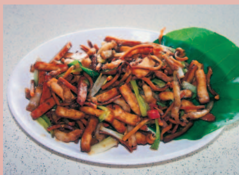
餐廳供應「客家小炒」