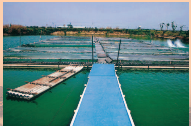
農場的錦鯉箱網養殖區