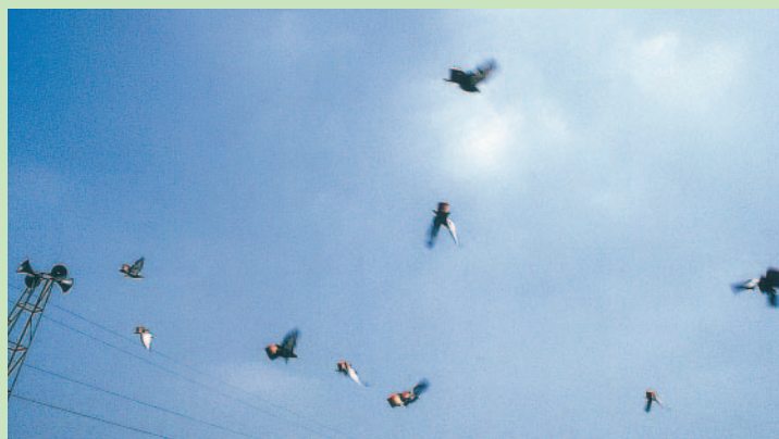
賽紅腳苓是學甲地區特有的農村文化

在農閒期，以一種物化的象徵，藉由鴿子指苓的儀式，達成與天接近，與天抗衡的遙響，是學甲地區特有的農村文化現象。農民以鴿子指苓來對抗大自然，鴿子飛翔時，透過風切入鴿苓所發出嗡嗡的低音，似乎是傳遞出農民的心聲，並象徵農村所存在的生命力，是非常值得傳承的農村休閒文化。