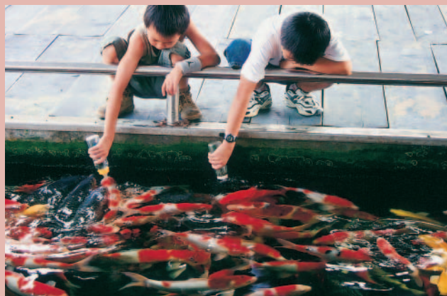
錦鯉奶嘴了了了秀

在自然生態污水處理池周邊，栽種多種台灣原生種水生植物，水草、蓮花遍佈，並飼養人工繁殖的土種鴛鴦；池內，則進行蓋斑鬥魚的復育工作，以創造自然溼地環境，達到有機物自然分解過濾，是教育解說生態平衡的最佳活教材。