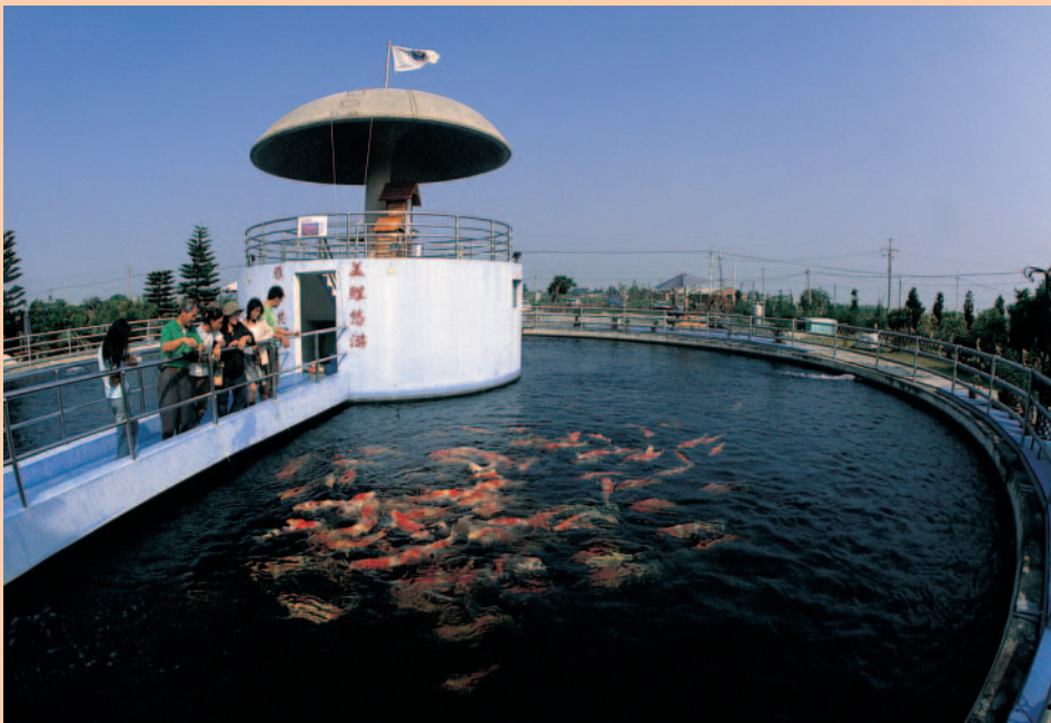
農場裏擁有目前全世界最大的錦鯉觀賞池