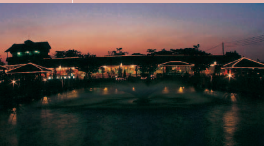
在燈火映照下，農場別有一番風情

登上農場的觀景台，眺望池鄉之美，農村田園景色，盡收眼底，令人心曠神怡。蓮花池設有水上平台，以浮橋串連涼亭雅座，在此品嚐咖啡、享用風味餐、欣賞錦鯉悠游，愜意人生不過如此。擁有世界最大的錦鯉觀賞池的農場，在夜晚燈火映照下，光影交錯，別有一番風情。