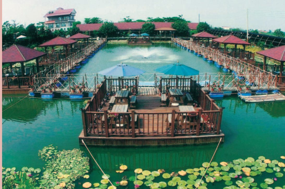
蓮花池上設置8個水上浮動平台

農場在蓮花池上，設置8個水上浮動平台，中式涼亭與雅座，以浮橋互相串連，在此品嚐咖啡、風味餐，邊欣賞錦鯉悠游，享受田園風光，尤其入夜後，在燈火映照下，別有一番風情。另外，農場精心