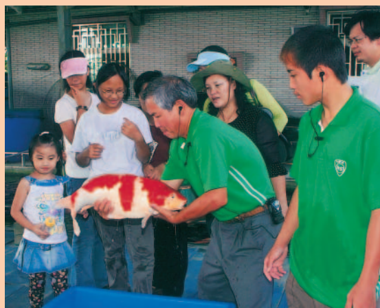
農場安排的抱大魚秀

錦鯉有紅、白、黑、黃、金、銀等多種斑紋；紅白、大正、昭和、寫鯉、別光等13類別。生性合群溫馴，色彩斑斕，花紋千變萬化，風格獨具。悠游水中，光彩奪目，難怪被讚譽為水中「游動の寶石」。