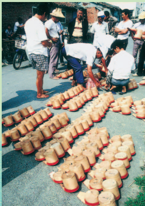
賽紅腳苓有100多年的歷史