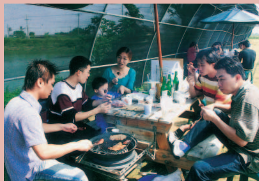
農場提供烤肉聚餐的設施