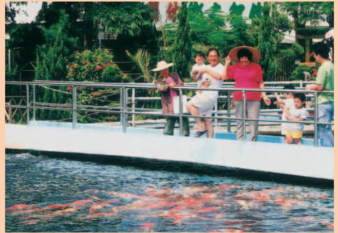
錦鯉讓人百看不厭

飼養錦鯉是一種精緻的水產事業，也是一種雅緻的休閒活動。台灣養錦鯉已有30幾年歷史，隨著國民生活水準提昇，人們對休閒生活內涵的要求提高，農場在錦鯉愛好者熱絡支持下，不斷地追求成長與進步，讓錦鯉成為廣受人們喜愛的水族寵物。