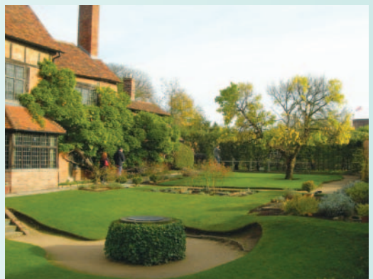
莎翁買給兒孫花園豪宅庭園一景