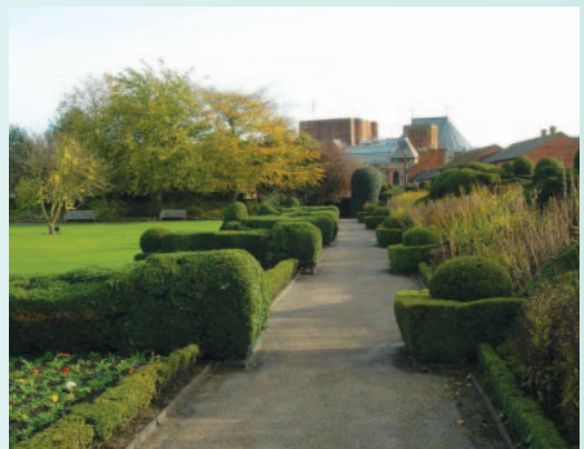
莎翁買給兒孫庭園豪宅