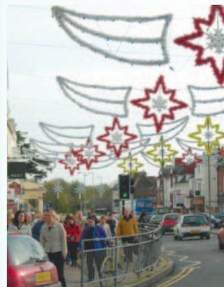
燈飾想必在夜間美侖美奐