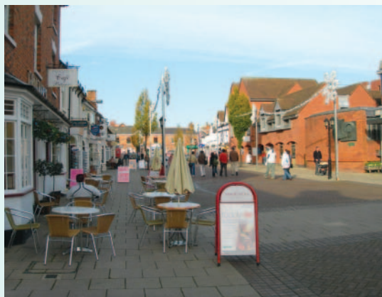
大街準備迎接新一天來自四面八方遊客