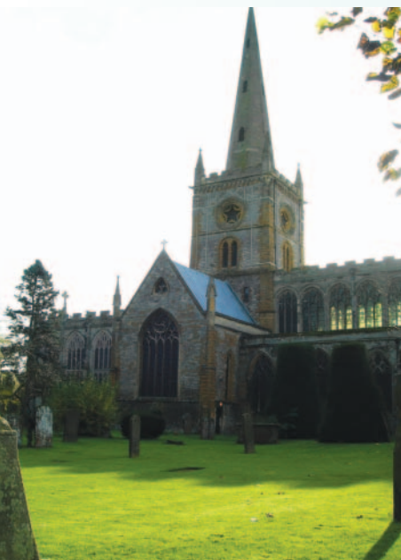
莎翁長眠之處聖三一教堂

院的股分，回到Stratford-upon-avon隱居。1616年4月23日在家鄉病逝，葬於鎮上的聖三一教堂。死前還下了毒誓，任何人動他的棺木將帶來史無前例的災難。後來歷史學家懷疑他是遭人毒害死亡，過去一年來熱烈討論將開棺驗尸，一代文豪的死因眼看即將掀起濤天巨浪。