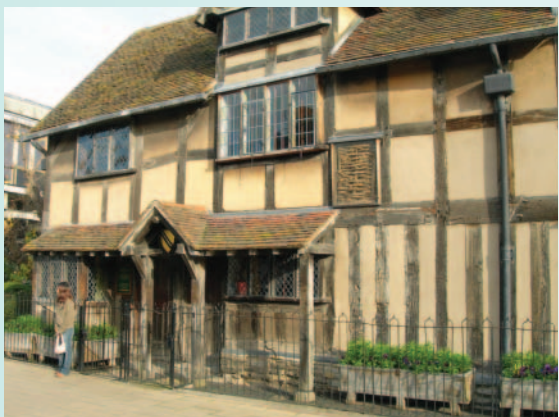
外觀保有300多年前樣貌的莎士比亞故居