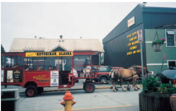
克治康市的觀光馬車