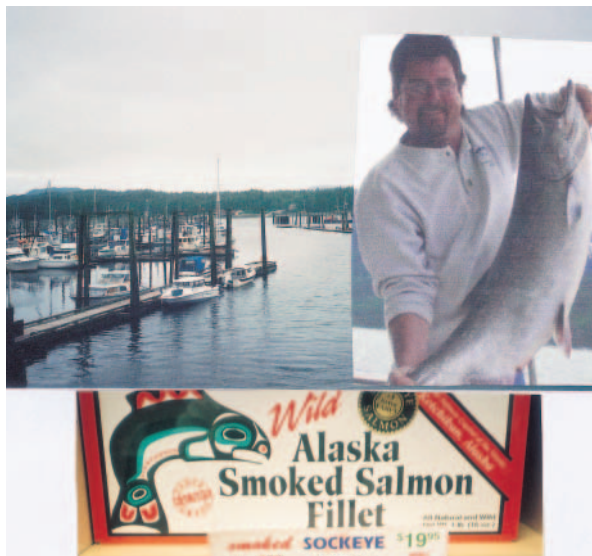
克治康市的觀光漁港，碩大的國王鮭魚是觀光客最愛

旅程的第4站克治康市位於阿拉斯加東南方的黎比基道島(Revillagigedo Island)。是阿拉斯加的第4大城，也是前往北方必經之地。1885年一名叫馬丁(Mike Martin)的白人，在克治康海峽附近買了160英畝的土地，經過多年的開發，發展成為目前熱鬧的城鎮。當初要前往遊康河的淘金客，也會經過此地，有些人喜歡這個地方，而選擇留下來。由於此地盛產鮭魚，魚產為本市的主要產業，有多家鮭魚罐頭及燻魚的加工廠。