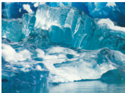
景觀壯麗的德來西峽灣

未料，這個已有107年歷史的森林老火車，如今竟成了絕佳的觀光資源。據1989年統計資料顯示，到斯凱克道搭乘老火車欣賞高山美景的人有580,000之多。由世界各地