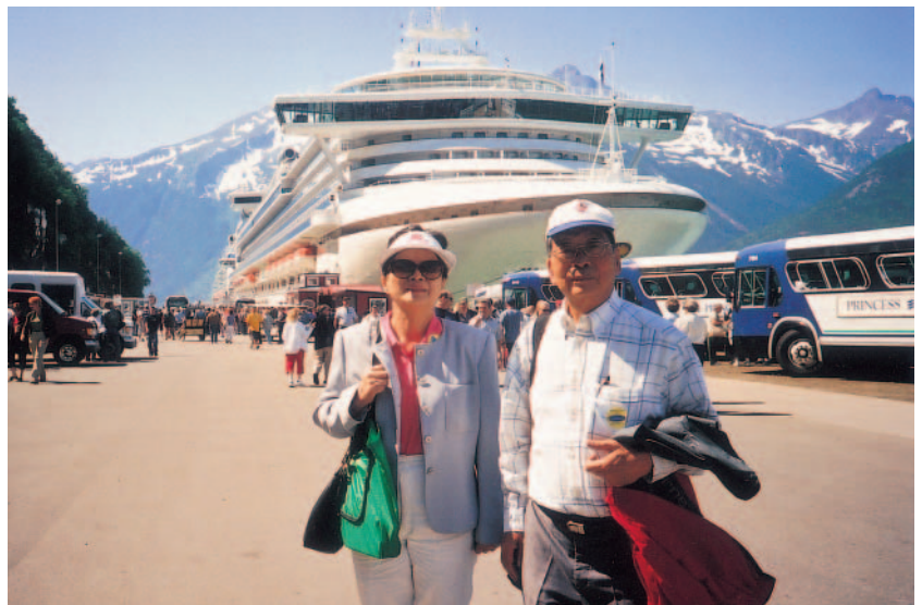
阿拉斯加的城市及煉油廠都在「愛之船」郵輪鑽石公主號停靠首府朱諾市

阿拉斯加最初由俄國人貝林(Vitus Bering)所發現，於是成為俄國的國土。俄國人在當地成立公司，狩獵海獺剝皮毛出售，卻因為交通不便，不符經濟效益而倒閉，在無利可圖的情形下，阿拉斯加成為無用之地。1867年，在美國國務卿西華德(William Seward)建議下，以720萬美元低價向俄國買下當時被認為無經濟價值的北方大地(1,477,261平方公里)。2005年阿拉斯加的生產毛額已達310億美元，每人的國民所得已達33,213美元，加上它所珍藏的天然資源(石油、天然氣、礦產、森林)及取之不盡的海產，美國人可以說在無意中獲得寶藏，這是132年前的俄國人未曾料想到的。艾森豪(Eisenhower)總統在1958年7月7日把它納入美國的第49州。