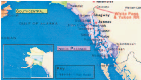
阿拉斯加沿海城鎮地圖

阿拉斯加，這曾經荒蕪的北方大地，因富含天然資源而興起，石油、天然氣、礦產、森林、海產、冰河奇景，身價由黑翻紅。而其人工孵育鮭魚苗，以保持產量優勢；利用百年運輸礦產火車，創造每年數十萬觀光人次，值得台灣借鏡。