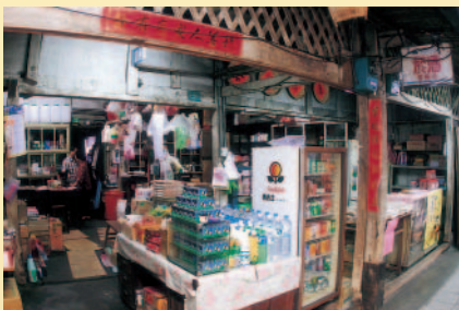
奮起湖老街古意盎然的商店