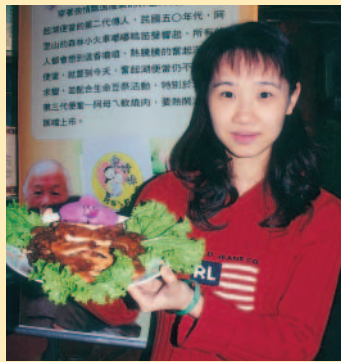
奮起湖大飯店推出的「軟燒肉」