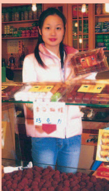
阿坤師特產店特有的巧克力麻糬