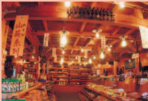
裝潢復古的阿坤師特產店