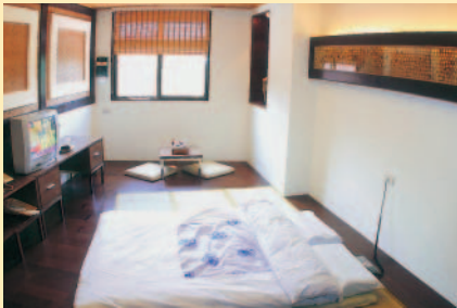
奮起湖大飯店日式雅緻客房