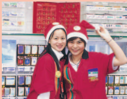
奮起湖大飯店開設台灣7-ELEVEN第4000家紀念門市