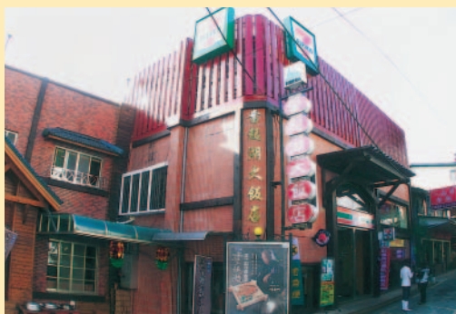
奮起湖大飯店外觀

漫步於奮起湖林中，有山嵐為伴； 稍感涼意的空氣， 落在臉頰上吸取一些暖意； 風中，不時捎來泥土的芬芳。 坐落於商店精華區的奮起湖大飯店， 將在地風情融入食宿， 結合現代的便利與令人懷念的古早味， 是旅人休憩身心的驛站。