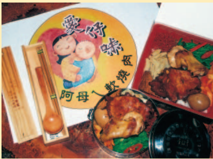
奮起湖大飯店的便當