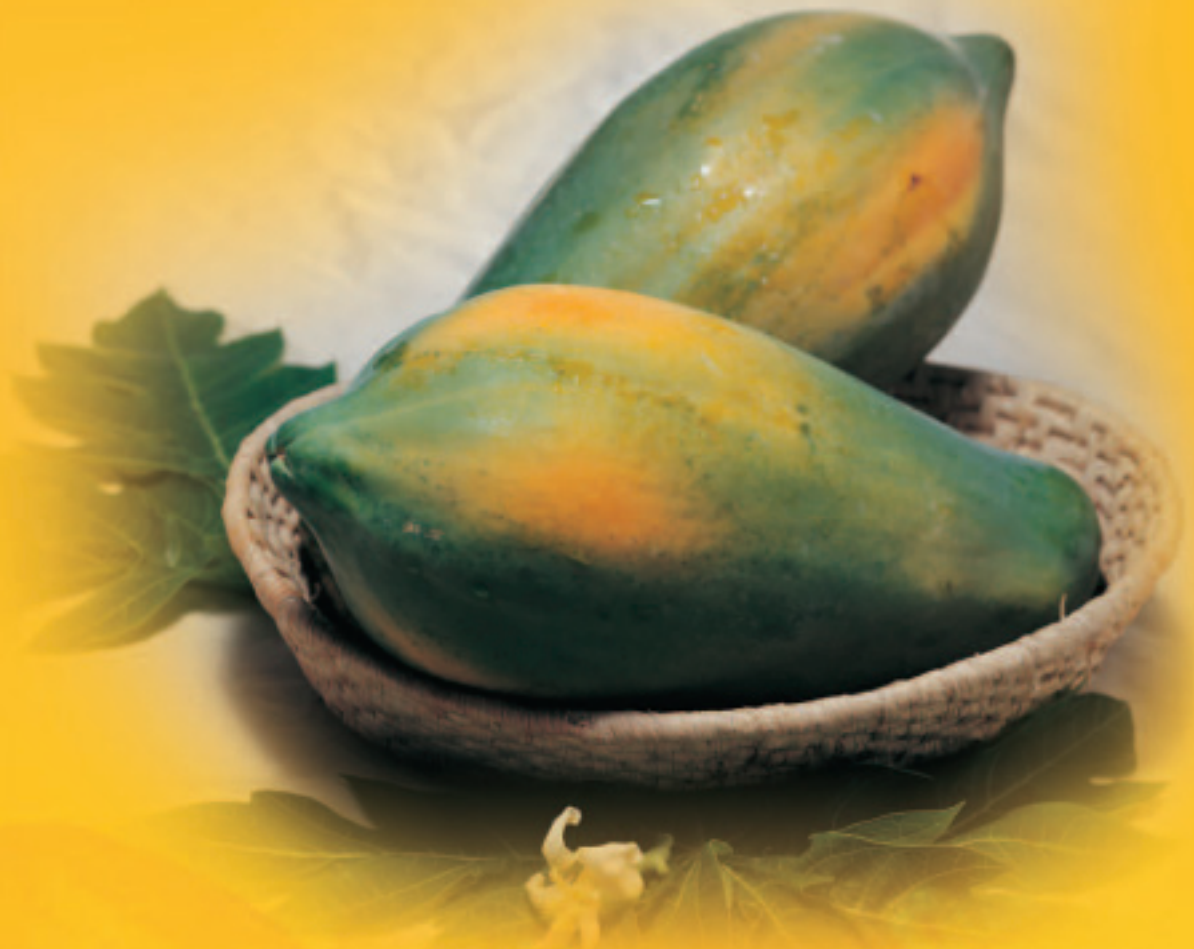
台灣數種外銷與進口水果之營養組成比較