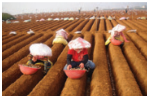
埔里所種的薑很多外銷到日本，日本銀髮族可在此看到栽種實境