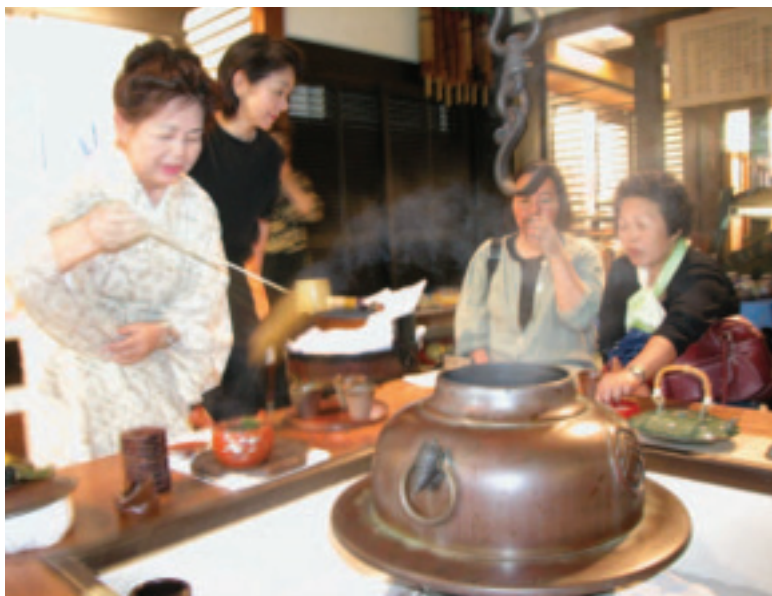
日本銀髮族以茶道文化與台灣居民交流

生於1946~1964年，即將面臨退休的嬰兒潮世代，將會徹底改變退休型態，他們即使到了50多歲，仍想過著