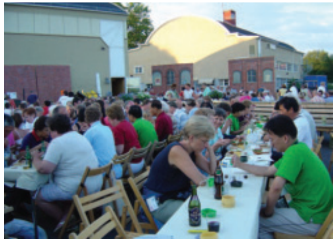
融入當地居民之體驗活動是日本銀髮族最喜愛的活動之一

1. 在第二個生命期間珍愛自己：在日本經過30至40年長期持續勤奮工作的生活後，日本銀髮族想要在他們第二個生命期間履行夢想，並於退休期間，有自由時間和足夠資金去享受許多消遣，例如騎馬、捕魚、划船、打高爾夫球等。由於他們所領的老人年金金額度不如預期地得以在高消費的日本本國生活，且為了拒絕他們公司在其退休後繼續留下作一些小薪水與小工作的提議，他們決定至國外