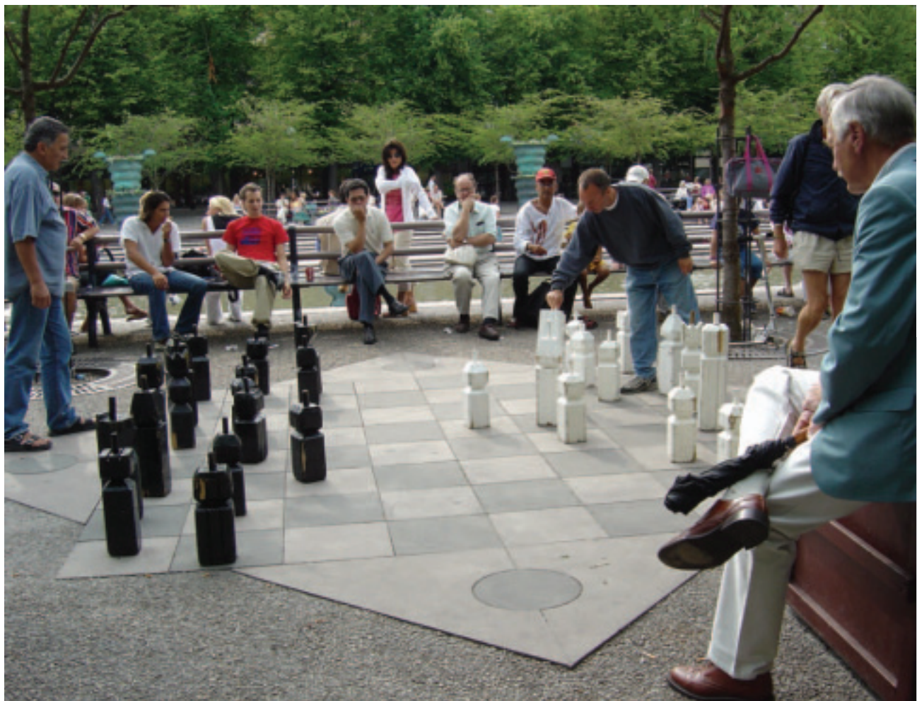
趣味活動也是日本銀髮族最喜愛的活動之一