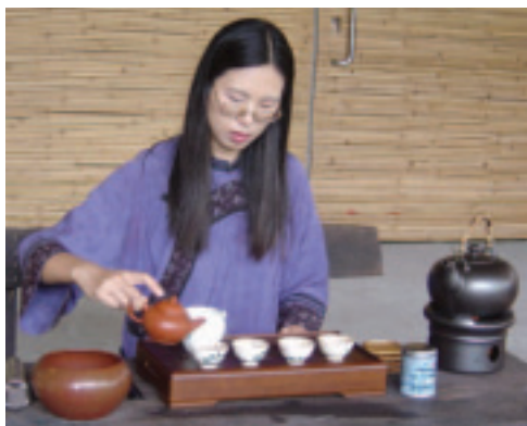
台灣的茶藝文化也是日本人嚮往的

在旅遊、觀光安排及地區文化參與方面，泰國除提供各式可以感受泰國變化多端的地理環境、風情萬種的景觀及活動外，亦規劃如研究古暹羅文化遺址、學習靜坐冥想課程、享受藥草三溫暖或SPA、探索國家公園內珍貴的動植物生態等休閒體驗活動，生活內涵相當豐富（泰國觀光局，2005）。而馬來西亞則以該國國家公園的豐富森林資源，及長逾4,800公里的海岸線吸引各國國外長宿休閒者前來休閒和放鬆。而為數超過190個的高爾夫球場遍及馬來西亞的高山、海濱、熱帶海島、參天雨林，或城市中心，更是吸引日本銀髮族前往的關鍵因素。（待續）