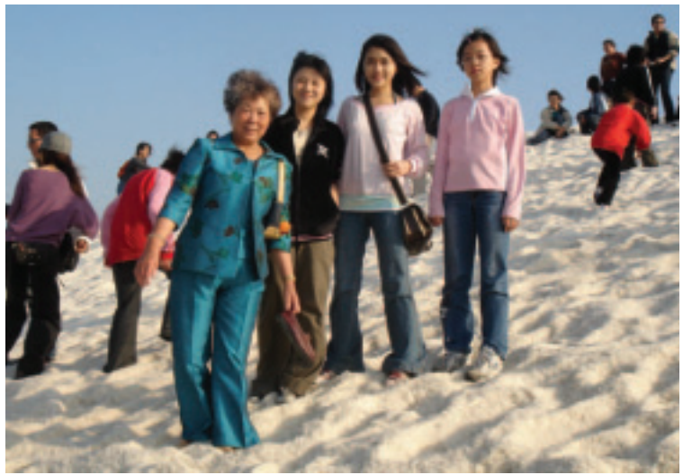
台灣特殊的爬「鹽山」活動，可讓日本銀髮族覺得趣味無窮

至於社區休閒活動方面，根據日本 Long Stay 推進連絡協議會調查，發現即將退休者退休後想從事的活動，依序為：趣味活動、旅行運動、志工活動、參與地區活動、學習技能、鑑賞文化及藝術等。且其在參與相關活動中，最重視的事項依序為：生活的意義、結交朋友、貢獻社會、活化所擁有的經驗與技能、幫助他人、自我成長。因此，建議各國欲辦理長宿休閒之業者應提供的社區休閒活動對策需包括：(1) 旅行、觀光；(2) 家庭菜園、農業體驗；(3) 釣魚及高爾夫等運動；(4) 圍棋、象棋；(5) 料理教室；(6) 與當地居民進行國際交流（日本NOP法人 Long Stay 推進聯絡協議會，2005）。