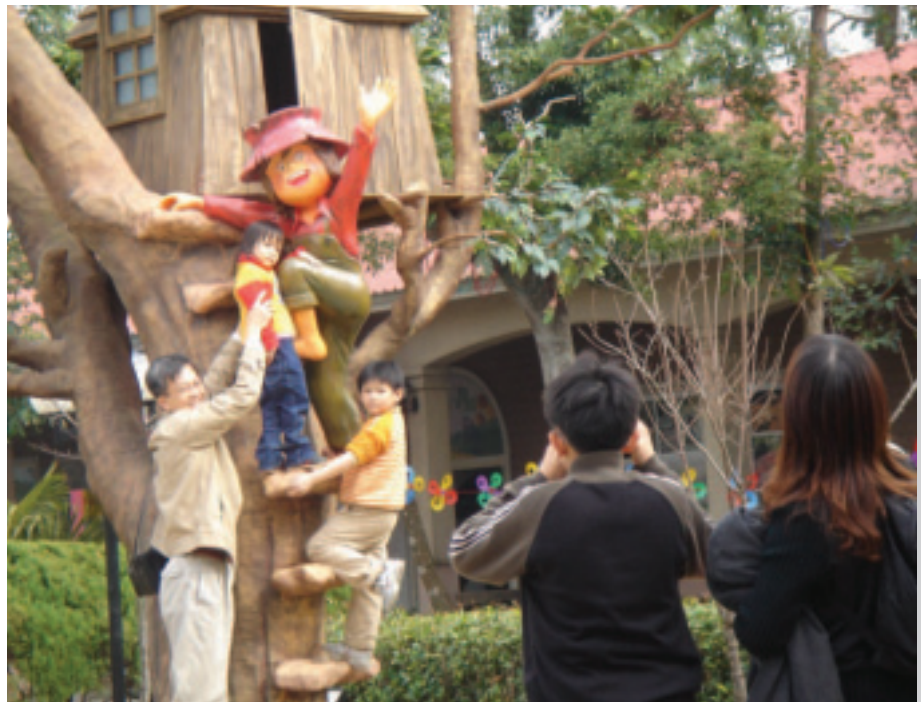
與小朋友共同歡樂或拍照，也是日本銀髮族感受最歡樂的事