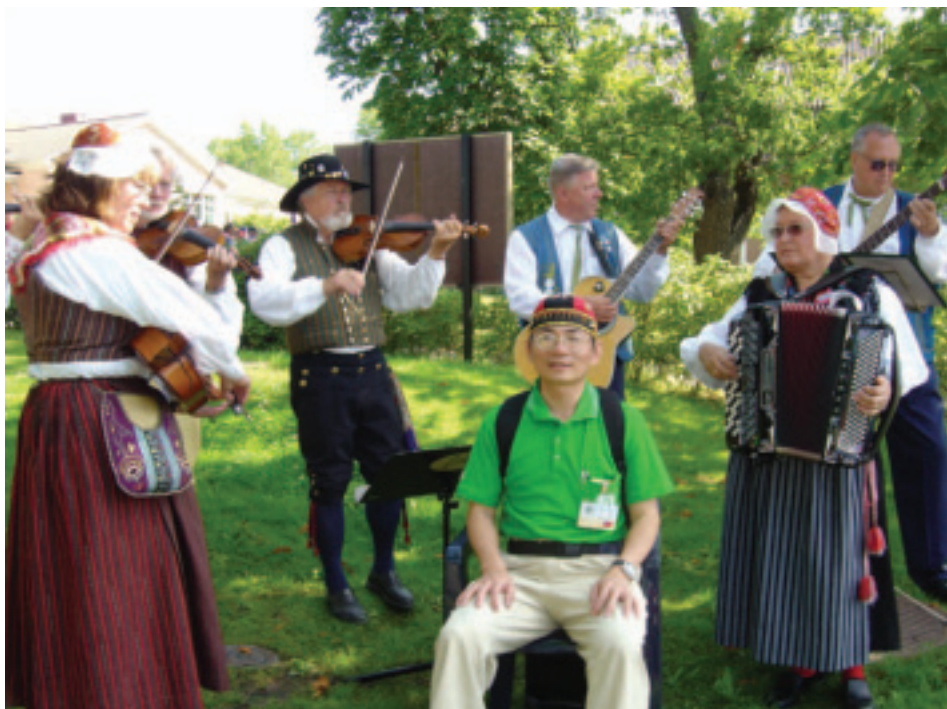
日本銀髮族喜歡至歐洲國家，感受不同傳統節慶

其實，比起任何一個年齡層，老年人是最具有休閒條件的，因為老年人不必為了升學而求學，不必為了家計而辛苦工作，睡眠時間也短，故一天24小時大部分時