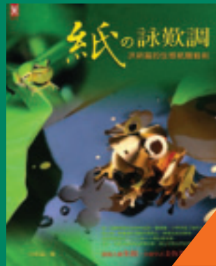
紙的詠歎調 洪新富的生態紙雕藝術 洪新富 著 350元