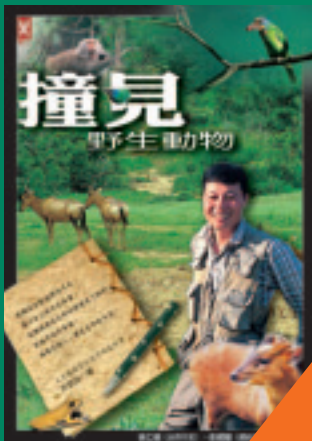
撞見野生動物 游登良 著 300元