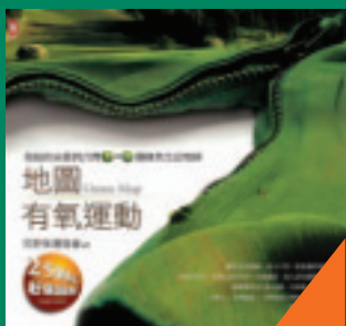
地圖有氧運動 風行全球Green Map 荒野保護協會 著 260元