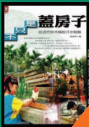
不只是蓋房子 玩泥巴拌木屑的汗水假期 胡湘玲等 著 220元