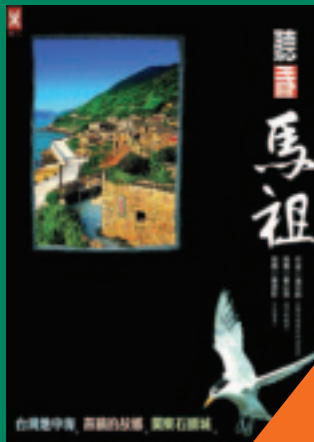
聽看馬祖 台灣地中海·燕鷗的故鄉·閩東石頭城 湯谷明 著 350元