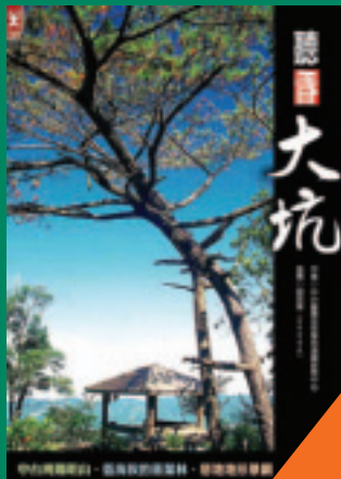
聽看大坑 中台灣陽明山 中台醫護技術學院 著 220元