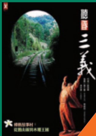
聽看三義 樟樹故事村： 從雪山線到木雕王國 薛淑麗 著 350元