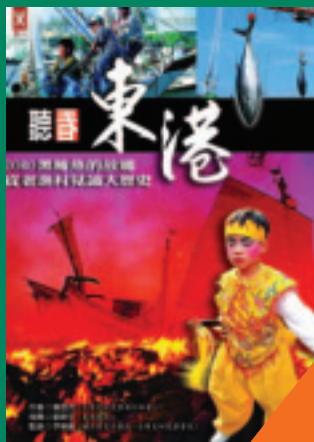
聽看東港從老漁村見識大歷史 葉志杰 著 360元