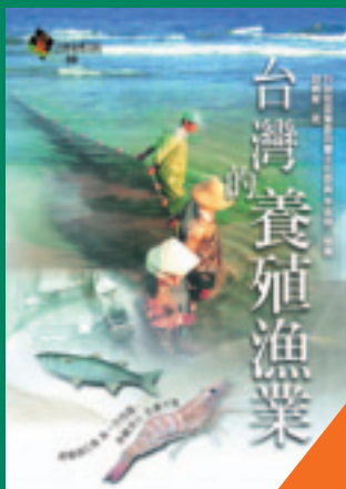
台灣的養殖漁業 胡興華 著 400元