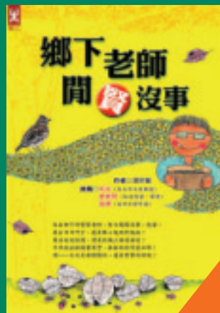
鄉下老師閒閒沒事 潘祈賢 著 200元