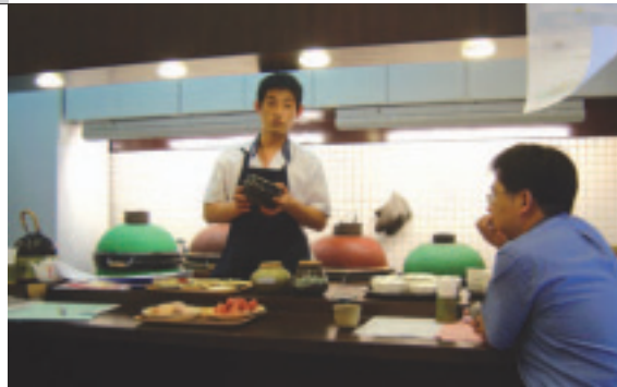
學習一道當地的佳餚，能讓long stay者很有成就感