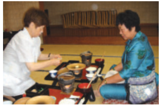
文化交流是long stay重要元素