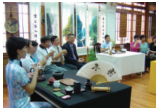
慶典活動的參與亦是long stay迷人之處