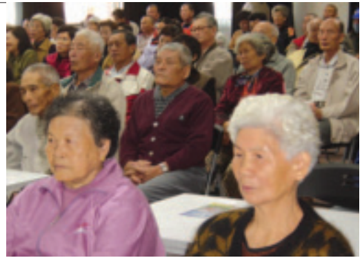
銀髮族也需要吸收新的知識與資訊

日本銀髮族從事國外長宿休閒的主要目的在於「語言學習」及「與當地居民文化交流」，以滿足日本銀髮族需求為前提，本研究提出5項執行方案，分述如下：