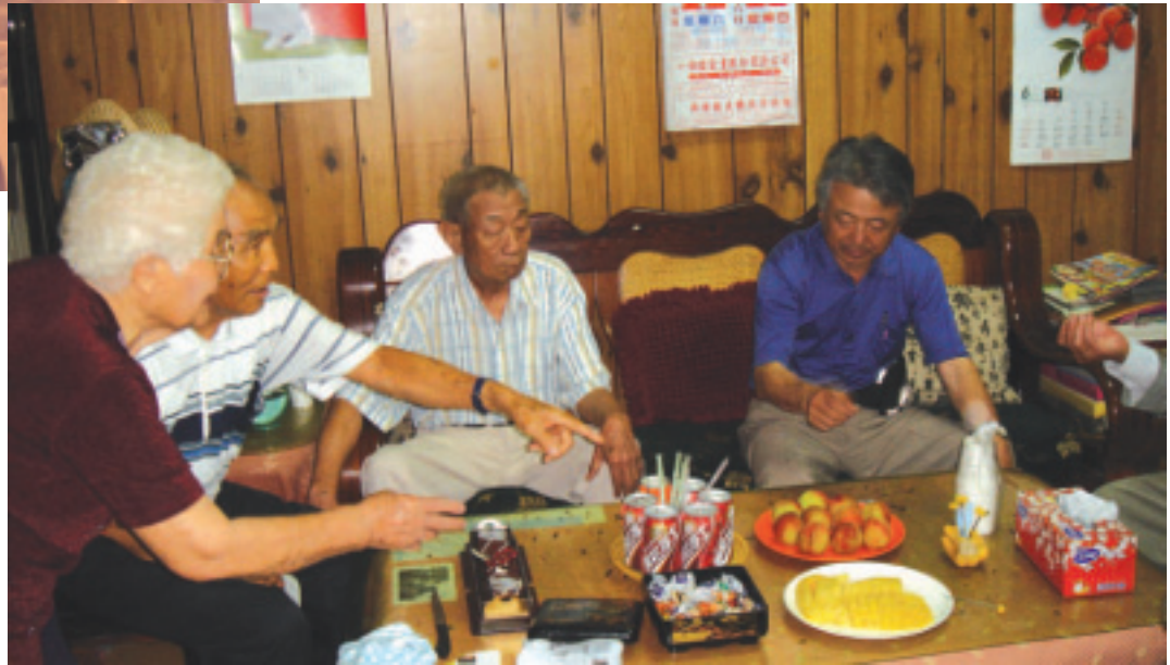
鹿野龍田村有日本移民村的記憶與歷史連結

根據交通部觀光局「94年9月觀光市場概況摘要」結果指出，該月來台的人次與93年同期比較之前5名分別為：日本97,970人次、美國22,726人次、韓國12,056人次、新加坡10,767人次及馬來西亞7,462人次。