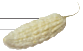
苦瓜的營養組成表