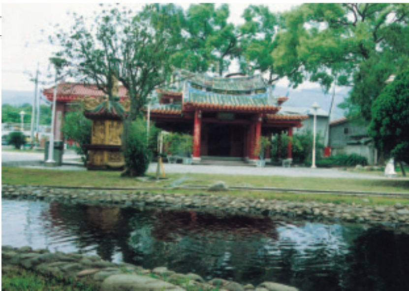
林先生廟前的老樹流水