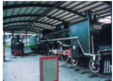
蒸氣火車頭陳列場