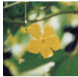
苦瓜小花，素雅無華

苦瓜最忌瓜實蠅等小蟲叮咬，講究的瓜園都搭建網室呵護。二水苦瓜園多為露地栽培，套袋材質也不甚講究，使用網狀保麗龍套袋比例甚高，保麗龍袋材質厚實，可減少瓜果碰傷，且採收後不需另外包裝就可直接裝箱運送，大幅精簡人力以及資材成本，但是防阻蟲蠅入侵效果微弱，品質難免受影響，應對人力老化，還有市場行情波動大風險，也是不得不的權宜措施。