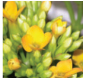
鵝黃色系的長壽花美得很難 不叫人多看它一眼

材料： 長壽花(黃色大棵，白色小棵)、白 鶴芋、仙人掌(大1棵，小3棵)、黑 石頭(大)、白石頭(中)、小白石、 鞋盒、白膠、披土、壓克力漆(黑)