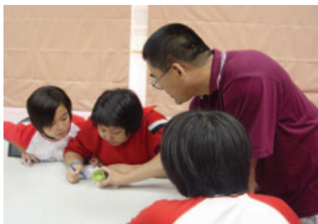
指導員細心製作作業研習海報

積穗國中學生家長多為勞動階層，雖在大台北地區，但清寒家庭不少，且平均每4位同學就有1位來自單親家庭，更多的是隔代教養的孩子，年邁的爺爺奶奶不知道如何為孩子們進行