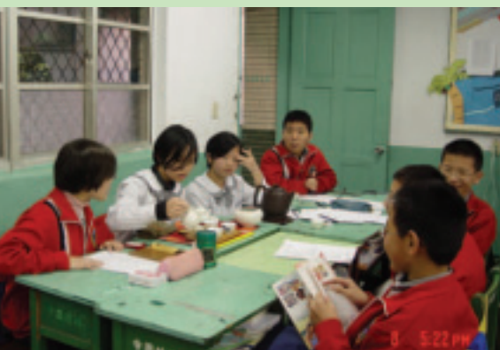
茶藝作業組分組討論

她表示，剛開始時，對新環境不熟悉，藉由辦理四健業務的過程得到很大的鼓勵與調整，最重要的是，與年輕的四健會員互動中，感受到孩子們真誠的回饋