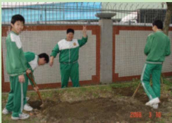
與學校合作蔬菜栽培作業組—開始前的荒地