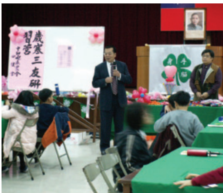
歲寒三友研習營開訓儀式

印象裡的中和地區，大樓櫛比鱗次，生活機能完善，外來人口眾多，其實中和地區也有農地讓人得以親近芬芳的泥土。秉持讓更多人親近泥土的理念，中和地區農會經舉辦活動，讓大小朋友在田野間奔跑、或讓風車、風箏、氣球在大地飛舞，不僅使侷促在狹隘空間的都會人身心得以鬆弛，對農會產生認同與肯定，也使農會擁有更為豐沛的能量。