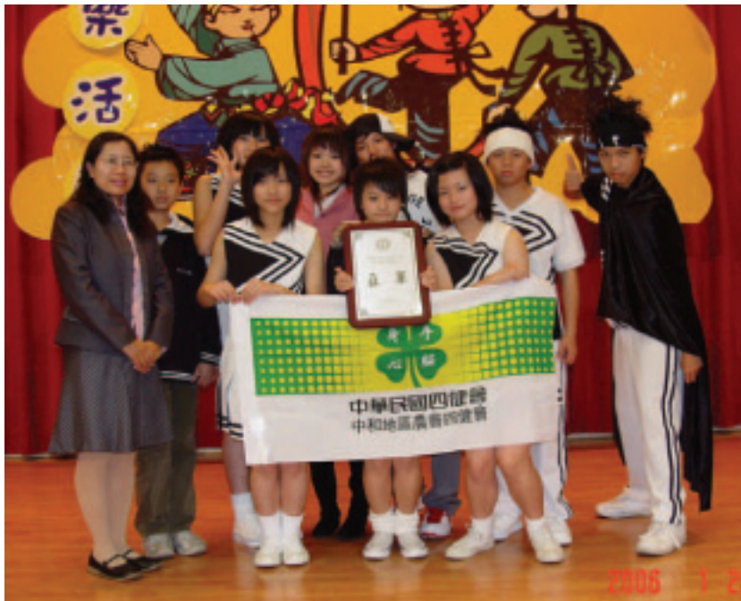
參加全國四健會員合影

了能力、知識之外，更需要熱忱服務的信念，朝著一天比一天成長、一天比一天進步的方向邁進，中和地區農會相信，根紮得更深，就有更多力量撐起一株擎天大樹！