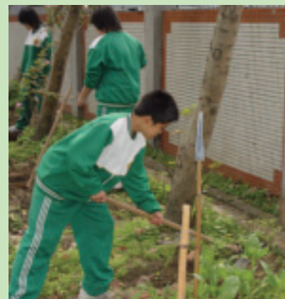
與學校合作蔬菜栽培作業組—小朋友認真耕作