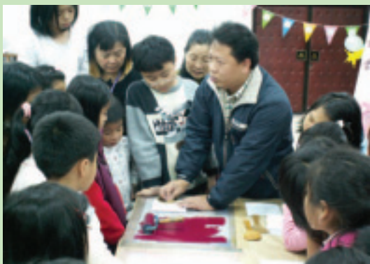
會員們認真凝聽製作藏書票方法