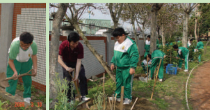
與學校合作蔬菜栽培作業組—大家開心地工作