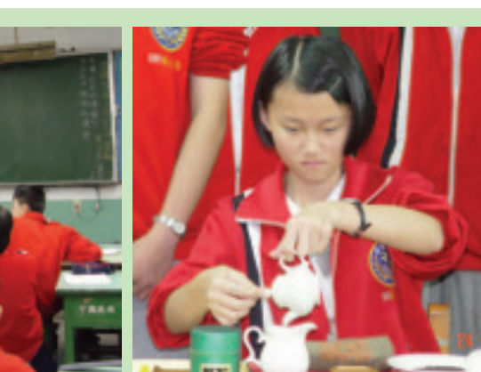
四健會員們認真泡茶的模樣

積穗國中學生家長多為勞動階層，雖在大台北地區，但清寒家庭不少，且平均每4位同學就有1位來自單親家庭，更多的是隔代教養的孩子，年邁的爺爺奶奶不知道如何為孩子們進行