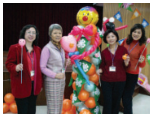
嚴謹的比賽裁判們