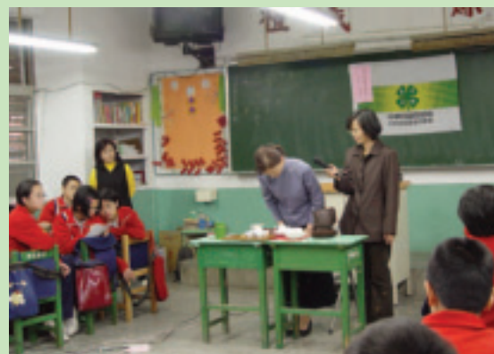
茶藝作業組老師指導四健會員泡茶