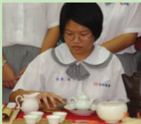
四健會員們認真泡茶的模樣