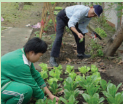
與學校合作蔬菜栽培作業組—小朋友種植的蔬菜