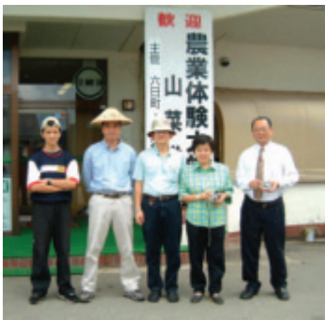
農業體驗大學校入學儀式

文／陳燕銀 台灣休閒農漁業文化創意協會 理事長 攝影／葉美秀 輔仁大學景觀設計系 教授