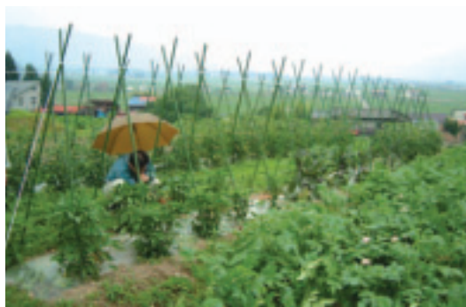
紅椒可是最受歡迎的體驗項目

當時日本各地也開始推廣休閒農業旅遊，如果綠季也能吸引遊客前來，那不就整年皆有觀光收入？因為在白季為供應大量觀光客住宿需求，農協也有棟渡假屋，綠季就可利用這個閒置空間，招攬遊客前來做各種農業體驗項目。為了讓遊客有深刻的印象，必須想個有趣的名稱，好好地包裝，如此才能一炮打響知名度。