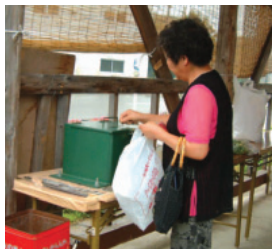
每個遊客都誠實投幣

舉解決很多問題。當所有農民都領回當初捐出的等同面積農地後，由於坡地拉平的關係，竟然還多出了近1,000坪的農地出來。面對這憑空冒出的農地，或許有人認為農協可直接接收，因為大家都已領到足夠面積的農地啦，這多出來的土地當然就歸農協所有，似乎也「名正言順」；更何況當時農業體驗大學校不是正急需用地嗎？有了這塊農地，大學校也可以辦理各種的耕作或摘採等下田體驗課程。