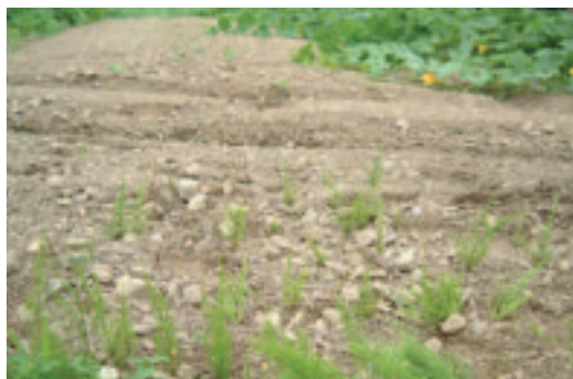
石頭比土還多的田也能種高品質南瓜

現在聽青野談到農業體驗大學校的草創時期，講起來或許雲淡風清，但確實是經過一段很辛苦、創業維艱的過程。一開始農