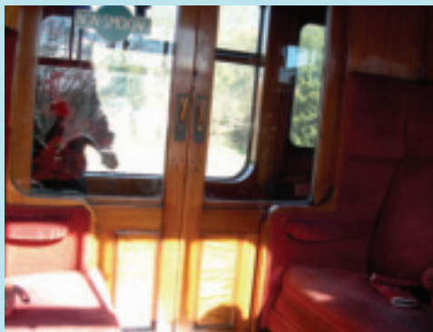
車內陳設古老簡潔

新投入服務。自1970年開始，民間募款活動不斷，到了1984年才完成目前總長16英里的路段。