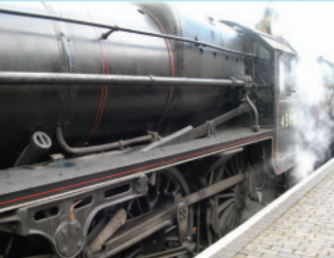
表裡如一的 蒸汽火車， 沈重剛強