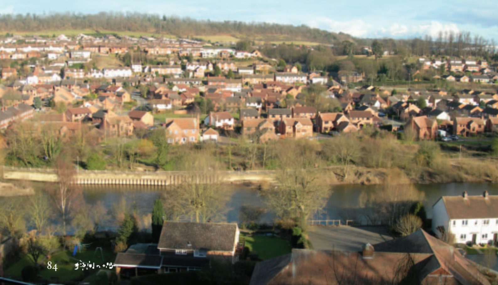
途經河岸住戶風景

道愛好者在1965年集資購買而來，當年他們以25,000英磅買下了其中5英里的路段，除了一段段的向政府收購鐵軌的所有權外，亦接手許多廢棄的蒸汽火車，花了數年改良和整修，後來終獲環境部發出許可經營，於1970年重