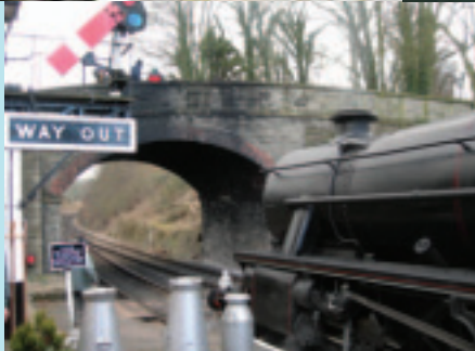
靠站的火車引起大家的目光

穿行過塞文谷(Severn Valley)長約16英里的標準規格的蒸汽火車，往來於英國中部的Worcestershire郡和Shropshire郡之間，已成了火車發燒友的必到之處。已經退役30年的