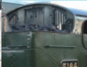
以煤炭為燃料，產生 蒸汽動力