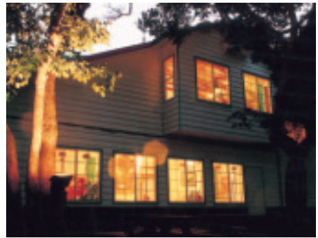
別緻典雅的住宿客房區