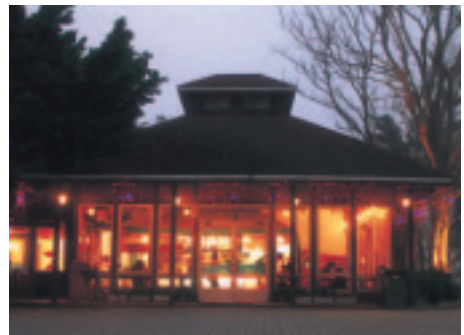
牧場設有青少年鍾愛的速食店