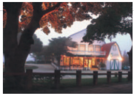
紅穀倉餐廳供應西式餐點

在住宿服務上，規劃有別緻典雅的套房、庭園式木屋，以滿足遊客不同的需求。此外，因應現今教育訓練、會議研習市場的需求，也規劃木造的會議室，提供機關團體、公司企業等使用。在飛牛廣場上，有翠綠的草坪可讓遊客們盡情地奔跑、嬉戲，或悠閒自在地放風箏、玩飛盤、觀賞牛隻羊群的活動，歡渡愉快的牧場假期。