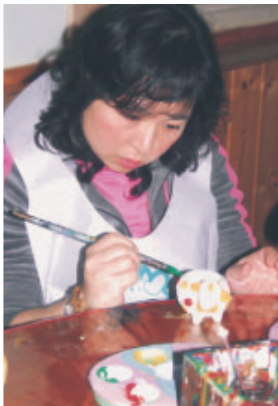
牧場每天安排彩繪DIY活動