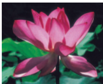
水生植物池的荷花盛開

春妍 —百花爭豔的春天，是花兒競妍的舞台，黃絨絨的油菜花，紅橙 橙的木棉花，綴滿綠色大地的裙擺，換上一襲襲亮麗的彩衣。