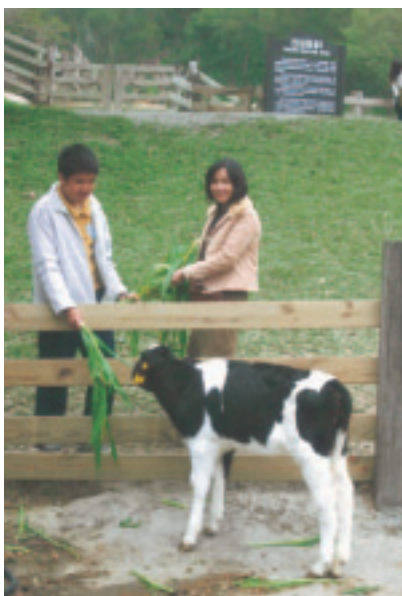
乳牛生態區開放供遊客參觀與餵食