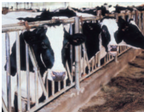
生產鮮乳的乳牛區