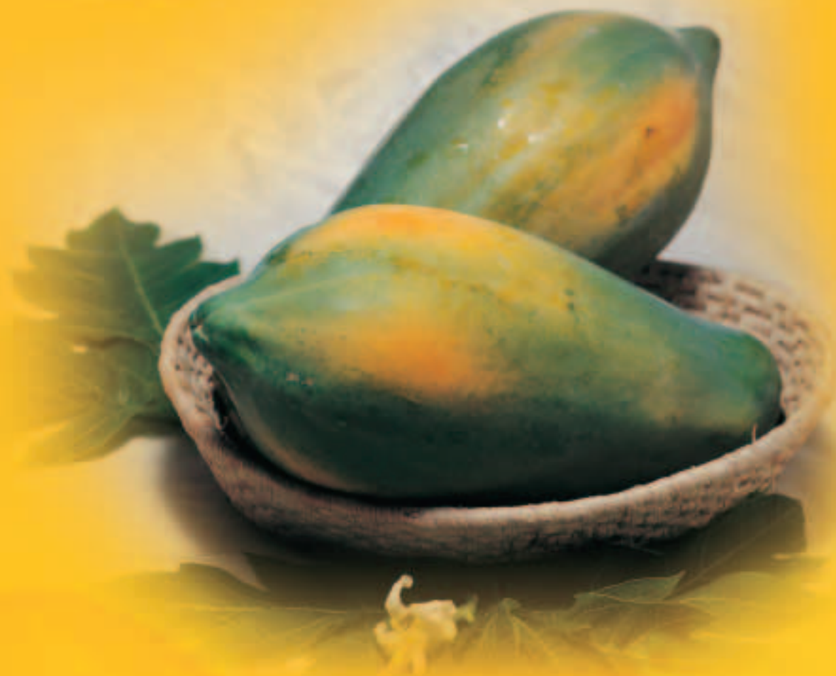
台灣數種外銷與進口水果之營養組成比較