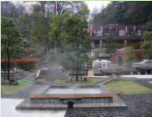
萬葉公園內的「足湯設施」