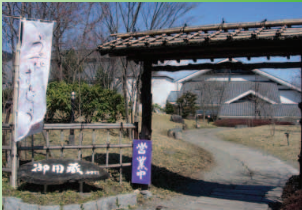
「御用藏」是頂級醬油及味噌的釀造館