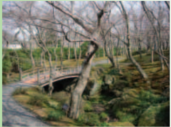
箱根MOA美術館的庭園造景

哲夫先生帶我們再訪箱根的MOA美術館，箱根位於日本首都東京西南90公里處，大家從品川搭火車到小田原站在轉往箱根湯本站後，再轉搭森林火車(會爬山的火車，呈「之」字型倒退轉彎)來到強羅站，然後又轉搭小火車往公園上站，大家正筋疲力盡時很快看到位於強羅站旁MOA的有機餐廳，我們選擇在此用餐，午餐全是以自然農法栽培的食材，簡單又極具特色。