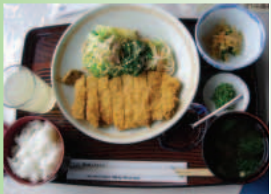
箱根MOA美術館的有機午餐

我們破例獲准進入園區的另一處，這裡曾是岡田茂吉大師在箱根的住所，庭園的設計古樸但處處充滿生活哲學，岡田茂吉先生早在1935年就提倡以自然農法生產自然食品以維護人體健康，因此當時向他請益農事、政論、人生等事的人很多，典型日式建築的日光寓所即為當時接見賓客、辦理藝術活動之處。