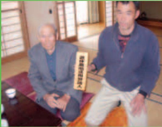
須賀父子接受訪談

水質更強調採用「神泉水」，並有泉水地窖體驗的設施，供遊客體驗終年保持11~12度的泉水其冰涼的感覺，在「御用藏」所展售的產品甚至我們最