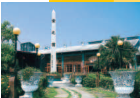
瑞穗「童之園」是為兒童所興建的樂園

從花東縱谷（台9號）公路進入瑞穗村後，賞玩瑞穗的所有行程，由此呈放射狀向外擴展。「童之園」顧名思義，是為兒童所興建的天堂，這裏原本是瑞穗鄉共同運銷集貨場的所在地，在休閒農漁園區的計劃補助下，希望能將傳統的農業活動與親子遊戲相互結合，過程中能深刻體驗農忙時的辛勞與智慧，期許下一代，不要因時代潮流的演變，而遺忘先民辛勤努力的成果。