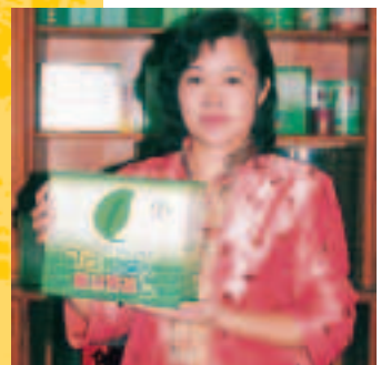
花東縱谷製茶冠軍落在舞鶴台地