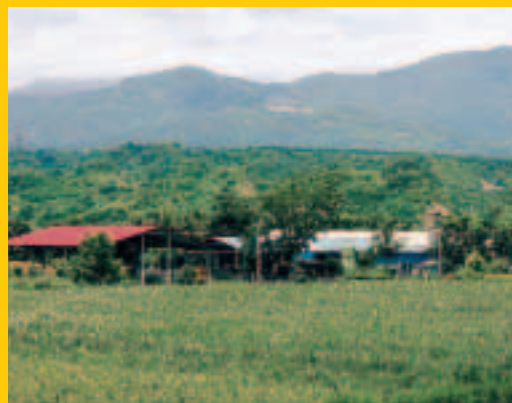
瑞穗「乳之園」的吉香牧場

拜秀姑巒溪泛舟國際性競賽，瑞穗牧場香純牛乳及舞鶴台地「天鶴茶」之賜，瑞穗鄉早已盛名遠播，成為花東縱谷中一顆閃亮的明珠。瑞穗鄉因農業發達，鄉村景緻宜人，配合觀光事業，可謂相輔相成。透過行政院農委會休閒農漁園區計畫的經費補助，整合瑞穗鄉豐富的農村資源，並導入生態旅遊的觀念，規劃出適當的休閒景點，串聯成田園生態旅遊動線，提供國人安排休閒渡假時，一處富含鄉村風情、農業教育與生態旅遊的好去處。