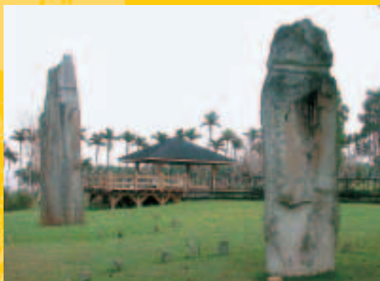
掃叭石柱傳說是阿美族原住民先祖的遺跡