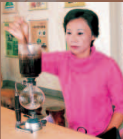
粘阿端用有機栽培種植的舞鶴咖啡豆煮出香醇濃郁的舞鶴咖啡

北迴歸線至南迴歸線之間的地區，最適合咖啡樹生長，而舞鶴台地的緯度、海拔與中南美洲咖啡產地相同，很適合咖啡