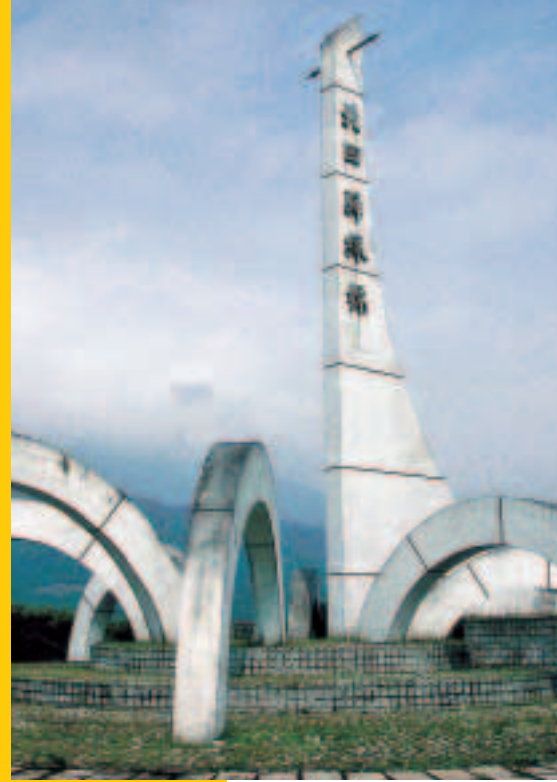
花東縱谷公路旁的北迴歸線標誌