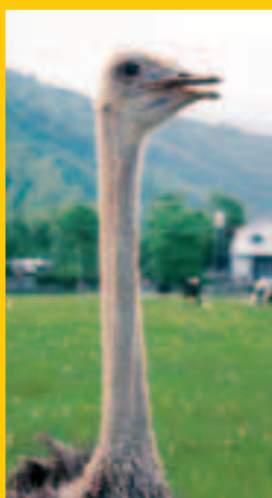
瑞穗牧場飼養的駝鳥