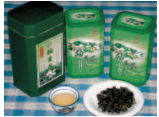
新開發的產品—「柚香茶」

為提升「天鶴茶」產業的形象，提高茶葉產品的消費，天鶴茶產銷第1班可說是挖空心思，積極開發多元化的茶葉產品，常見的有綠茶粉、茶羊羹、茶酥餅、茶焗蛋、茶糖、茶枕、茶餐等，並配合時令、節慶、地方產業及消費者的健康意識，推出各式鮮美可口的新產品，如：碧羅春、蜜香紅茶冰沙、甜點紅茶凍、柚香茶、綠茶酥，以及在中秋節推出的「綠茶月餅」、「柚香月餅」。