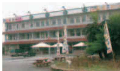
台9號公路旁的東昇茶行附設農村民宿