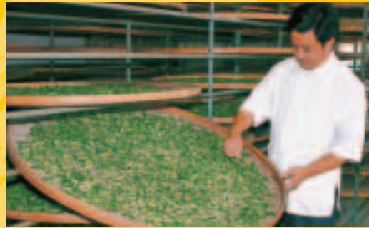
舞鶴台地「天鶴茶」已盛名遠播