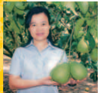
鶴岡文旦柚品質直追斗六文旦