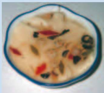
榆樹豆腐，著名美食

榆樹大豆尤其聞名中外，一系列的豆腐製品，如大豆腐、水豆腐與乾豆腐等，別具風味與特色。五棵樹鎮出產的乾豆腐，向來以薄、韌、乾、香等特點有名，在東北亞市場甚受歡迎。當地名廚則以豆腐做出包括砂鍋豆腐、鯰魚燉豆腐、麻辣豆