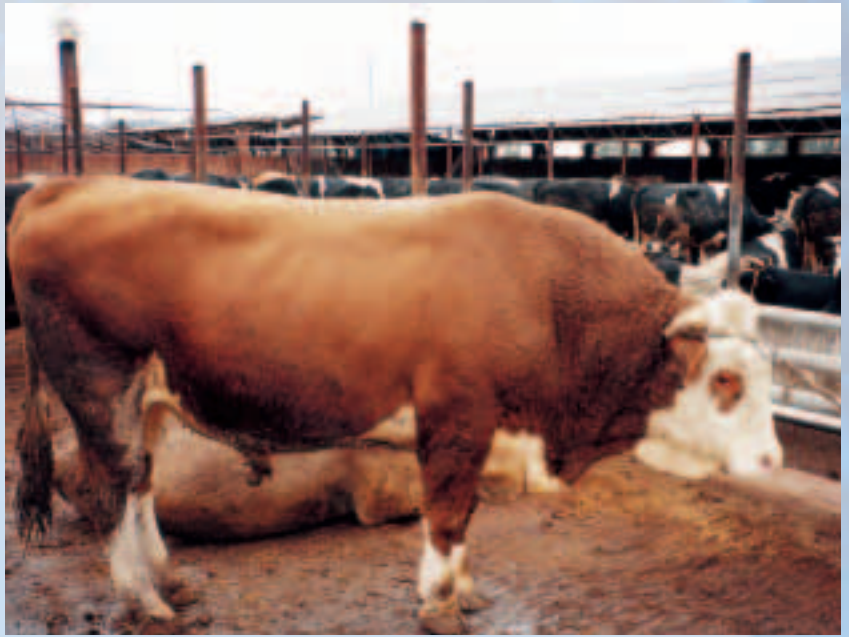
酒糟飼育的榆樹肉牛，膘肥體壯

幾年前，吉林省建設廳移民辦公室引進資金，興建了吉林省庫區五棵樹肉牛繁育中心，總佔地面積25000平方公尺。另外，近年也陸續建立了牧業小區，小區內以養牛大戶為單元，建有15個養牛基地，每戶佔地4000平方公尺，小區可釀酒6000噸，產糟10000噸，出欄肥牛3.5萬頭。牧業小區的建立，完成了「糧食釀酒，酒糟育牛」的糧食轉化利用，實現糧食再增值。牧業小區進行規模經營，為中國養牛與釀酒業的發展，起了帶頭與示範的作用。同時，也為榆樹市養牛與釀酒業的市場化，創造了更優越的條件，促進