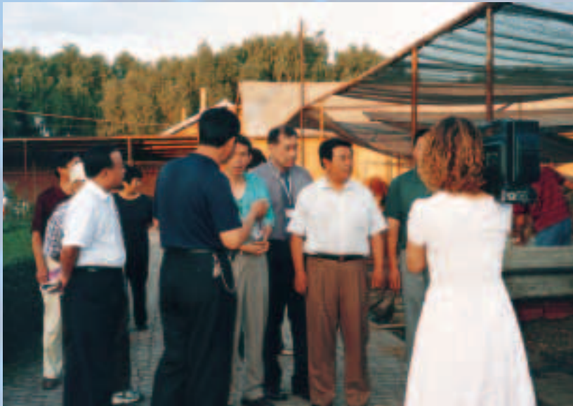
台灣生態農業考察團參觀榆樹酒糟育牛