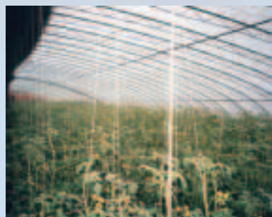
大棚（溫室）內種植「反季」蔬菜