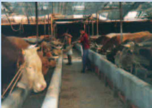
管理人員定時清掃牛欄