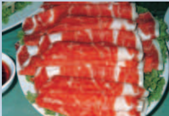
鮮嫩美味的肥牛肉片