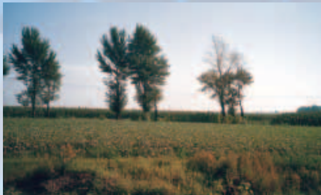
榆樹市純樸美麗的田園風光