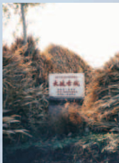
大坡古城為遼金文化遺址