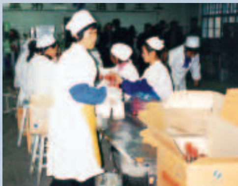
玉米釀造的榆樹酒，曾獲國際殊榮