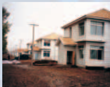
蔬菜生產區旁的現代化農宅