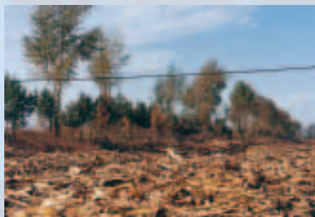
城垣旁的低窪地為當年的護城河

根據考古調查，榆樹市境內有非常豐富的遼金文化遺址，其中主要分布在松花江沿岸、拉林河流域與中西部地區。在全縣11座古城裡，以遼金重鎮大坡古城的規模最大，現已被列為省級重點保護文物保護單位。古城遺址位於大坡鎮東南2公里處。城形為不規則的長方形，東牆長1050公尺，西牆長840公尺，南牆與北牆各長630公尺，周長3150公尺。城牆外有10多公尺寬的護城河，至今仍可看到其低窪地勢。古城有東、西、南、北四門，城門寬約10到20公尺。城四角有角樓，四面牆垣設有突出呈半圓形牆的馬面，多達18個。角樓與馬面互為犄角，乃是防禦敵人攻城的軍事建築。