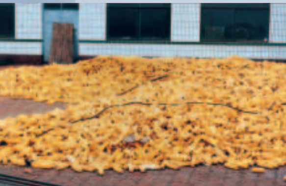
黑土帶生產的黃金玉米