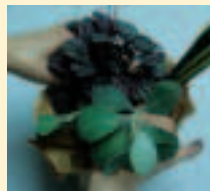
10. 虎尾蘭旁邊種入松葉牡丹或其他植物(皺葉焦草)