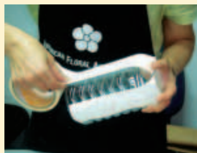
1. 保特瓶剪掉頭部後貼上雙面膠