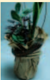
14. 最後以葉蘭葉裝飾牛皮紙