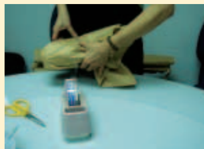
3. 利用透明膠帶固定