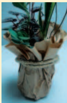
13. 透明膠帶處加粗麻繩裝飾