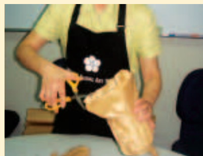
4. 多餘的牛皮紙剪掉