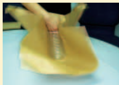
2. 用牛皮紙包保特瓶外圍