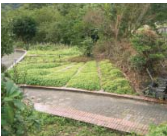
藥用植物園須專人解說

域，針對以上各區不同的屬性，分置教育中心、有機果園區、森林步道、苗圃園、樹木標本園、藥用植物園、地圖解說牌等，以提供民眾親近自然、認識生態保育環境的機會。