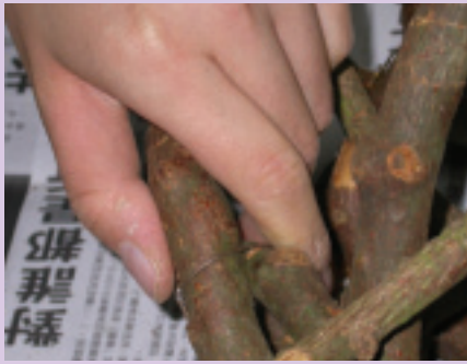
4. 鐵絲得固定好否則容易彈開