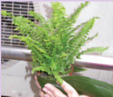
9. 波士頓蕨經過葉蘭葉包過後美觀多了