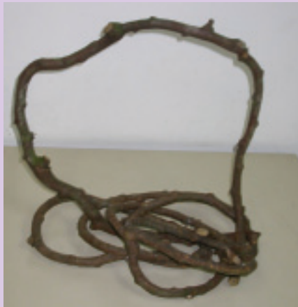
5. 固定好後的粗藤可以站立起來