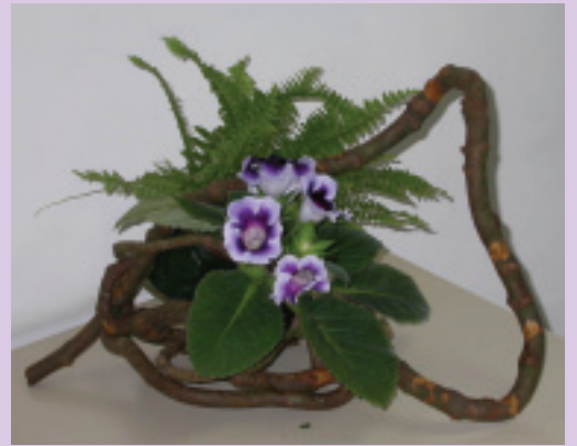
10. 大岩桐一樣利用葉蘭葉將塑膠盆包好後，直接嵌入粗藤中，波士頓蕨也嵌入後作品完成