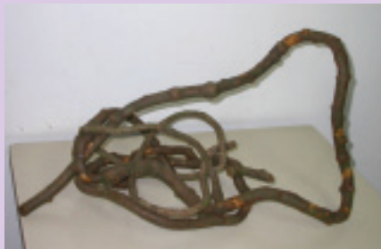
6. 也可將粗藤橫著放