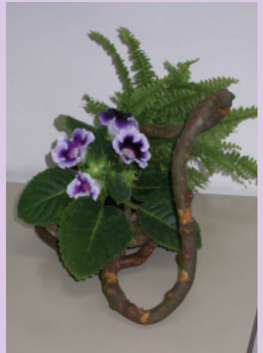
11. 整個作品橫過來放又是另一番味道