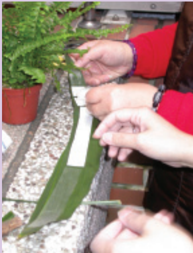
7. 葉蘭葉背後貼上雙面膠