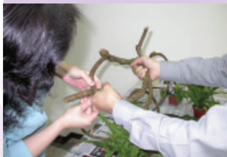
3. 3支粗藤分別用鐵絲綁好後利用重疊的方式將3支粗藤固定在一起