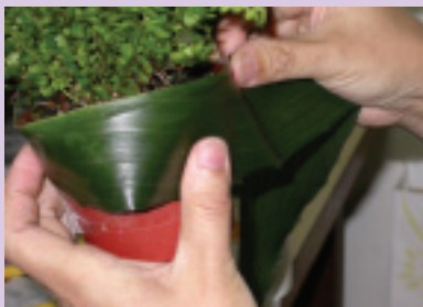
8. 醜醜的塑膠盆用葉蘭葉包起來