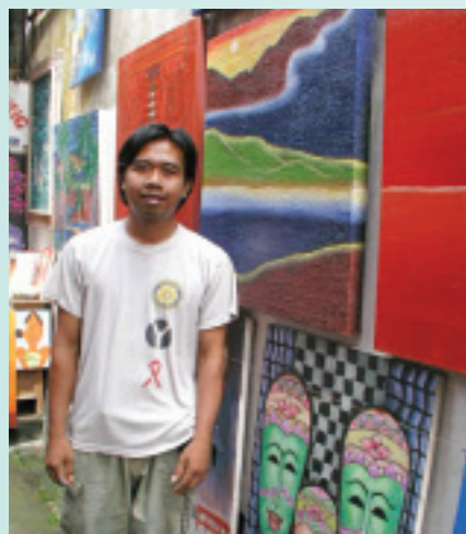
隱居小巷裡的素人藝術家

工藝品的切魯卡、手染織布中心吉安雅及以石雕聞名的巴土布蘭等，圍繞在烏布周圍半小時車程內，眾星拱月的烏布則是音樂、舞蹈、繪畫重鎮，也是這些村落藝術品的展示櫥窗。