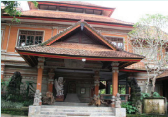
烏布三大美術館之一，NEKA美術館

巴里島女性藝術家協會（Association of women Artist in Bali）則是另一個值得一提的烏布現象。西元1991年，一位遠嫁印尼藝術家的英國