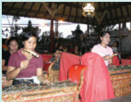
趁著家務空檔練習的社區婦女甘美朗樂團