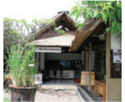
烏布旅客服務中心外觀