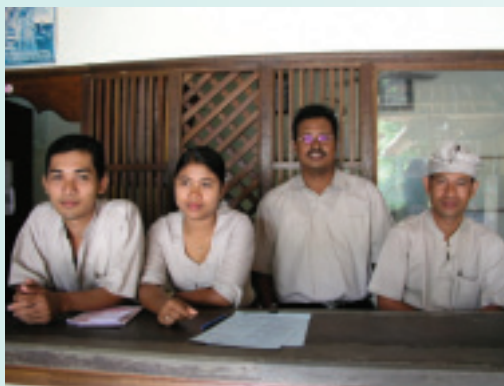
親切熱情的旅客服務中心義工，是烏布旅遊好幫手

烏布(UBUD)位於巴里島中部，距離國際機場1個小時車程，行政區域屬於吉安雅縣，地名來自於烏拔(UBAD)，巴里語指一種以生長在坎普漢河具有療效的藥草製成的藥物，古王朝時