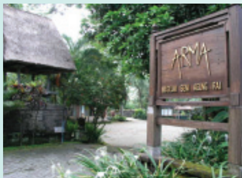
烏布三大美術館之一，ARMA美術館

王室，點亮藝術的第一根火柴，讓烏布擁有傲人的歷史資產，以及發展觀光的獨家優勢，僅