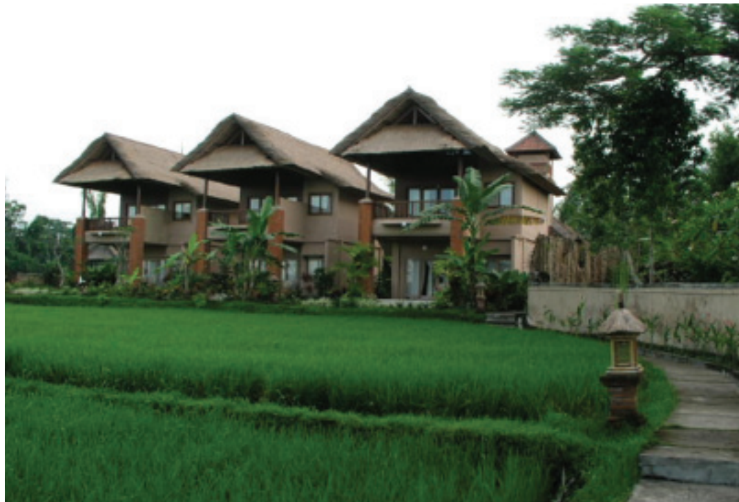
巴里島式的旅館建築與田園景觀營造的濃濃休閒風

白天逛美術館、畫廊，晚上的活動則非舞蹈表演莫屬，沒看過華麗舞伶會說話的纖纖十指，沒體驗過甘美朗音樂從四面八方敲進耳朵的暢快，千萬別說你來過烏布！