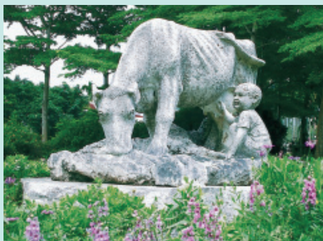
表現活潑生動的「小孩與乳牛」