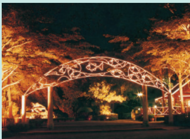
園區拱橋型大門夜景