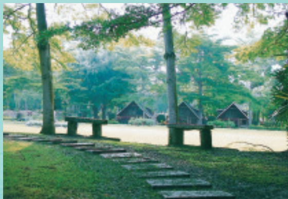
園區使用原石鋪設的步道