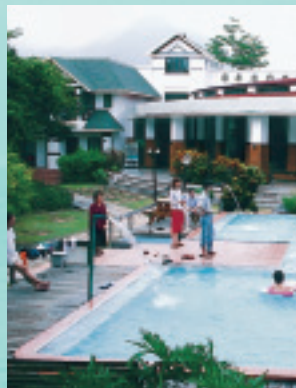
會議廳外觀與兒童戲水池