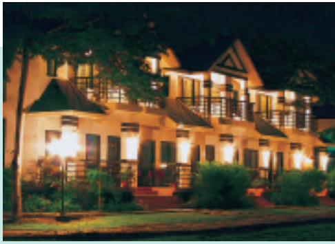
新近落成啓用的盧森館外觀夜景