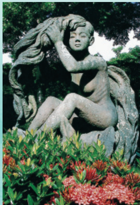
採當地曾文溪石雕成的「芙蓉仙子」