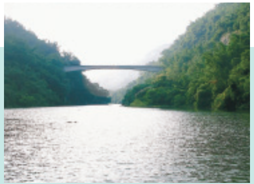
高懸在曾文溪河谷上空的大埔橋

位 於西拉雅國家風景區的「大埔」，是一個依山傍水的小山村，海拔230~1,100公尺，四面環山，有馬頭山、凍子嶺、三腳南山等，其中，以馬頭山海拔最高，有1,100多公尺，因山形似馬頭而得名，被視為大埔的聖山。