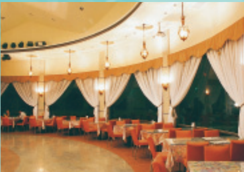
挑高優雅的咖啡屋

位 於大埔鄉湖濱公園旁，毗鄰曾文水庫的歐都納山野渡假村，完全依照自然環境、森林植物來規劃，頗富有「山野」的味道。在工作人員細心照護下，園區景色四季如春，更因地處森林保育區內，鳥類資源非常豐富，種類多達60餘種。最常見的鳥類，有渡假木屋後方，亦即水庫造林地的金背鳩、白頭鵯、台灣藍鵲等，而在舊碼頭附近水域，常可見到翠鳥、白鷺鷥、白鵲鴿等棲息活動。