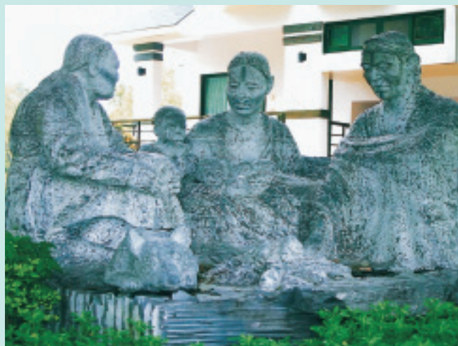
原住民人物石雕作品