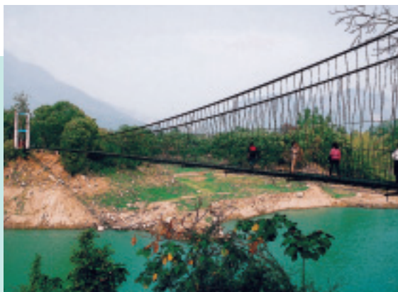
情人公園與聯絡湖濱公園的同心橋

大埔，自然而不原始，鄉居而不落後，可遠離都市塵囂，享受讓心情完全放鬆的山林生活！