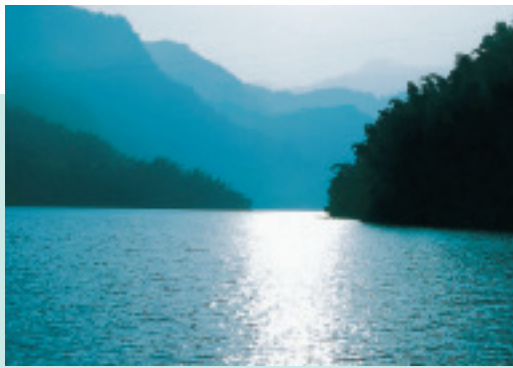
金色的光束使水域泛起粼粼波光