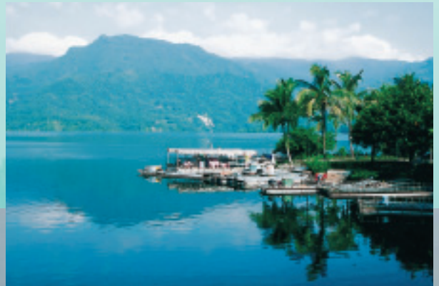
同心橋旁的漁人碼頭

情人公園依偎在曾文水庫湖邊，與大埔鄉最高峰之「馬頭山」，僅有一水之隔，占地廣闊，花木艷麗，在白天，提供遊客賞景、休憩之用，傍晚入夜