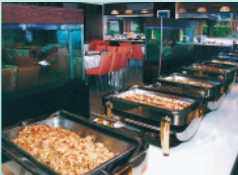
自助式地方風味晚餐