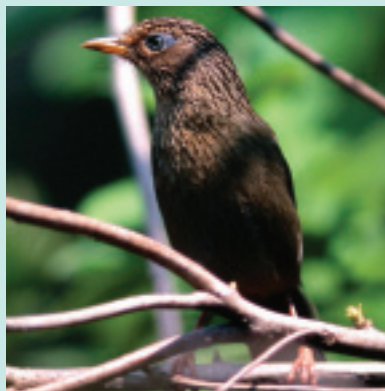
台灣畫眉

台灣15種特有種鳥類：1. 藍腹鵲 2. 黑長尾雉 3. 台灣山鷓鴣 4. 台灣藍鵲 5. 黃山雀 6. 紋翼畫眉 7. 台灣噪眉 8. 白耳畫眉 9. 黃胸數眉 10. 冠羽畫眉 11. 台灣紫嘯鶇 12. 栗背林鳴 13. 火冠戴菊鳥 14. 台灣叢樹鶯 15. 烏頭翁。